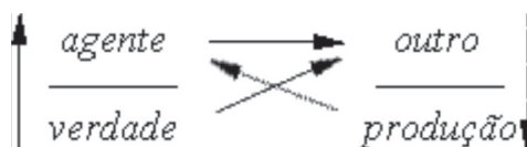
Figura 1 – Lugares do discurso

Como a ordem dos elementos é definida em princípio como invariável, resultam daí quatro possíveis combinações: o discurso do senhor, o discurso da universidade, o discurso da histeria e o discurso do analista (FIG. 2).