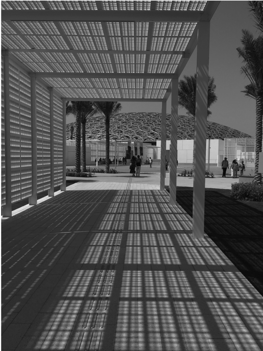
Fig. 3 : Le musée du Louvre, le Louvre-Lens et le Louvre Abu Dhabi : trois architectures différentes et une même identité