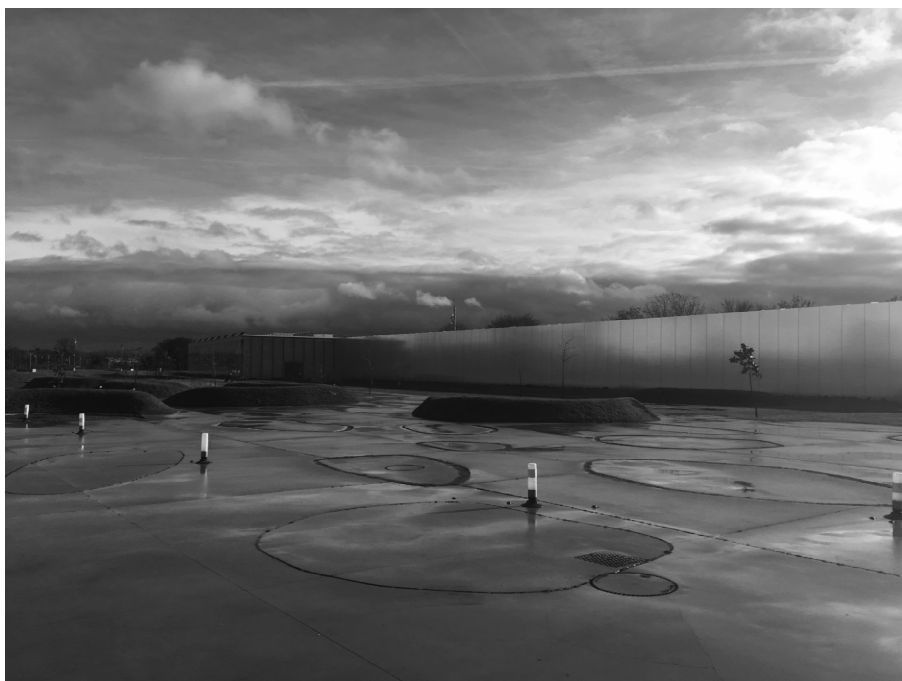
Fig. 4 : Le musée du Louvre, le Louvre-Lens et le Louvre Abu Dhabi : trois architectures différentes et une même identité