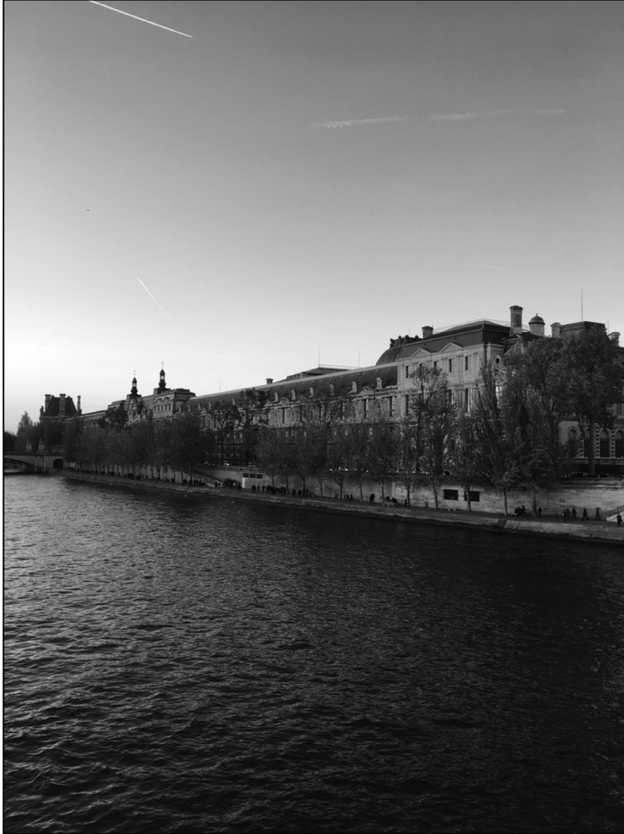
Fig. 2 : Le musée du Louvre, le Louvre-Lens et le Louvre Abu Dhabi : trois architectures différentes et une même identité