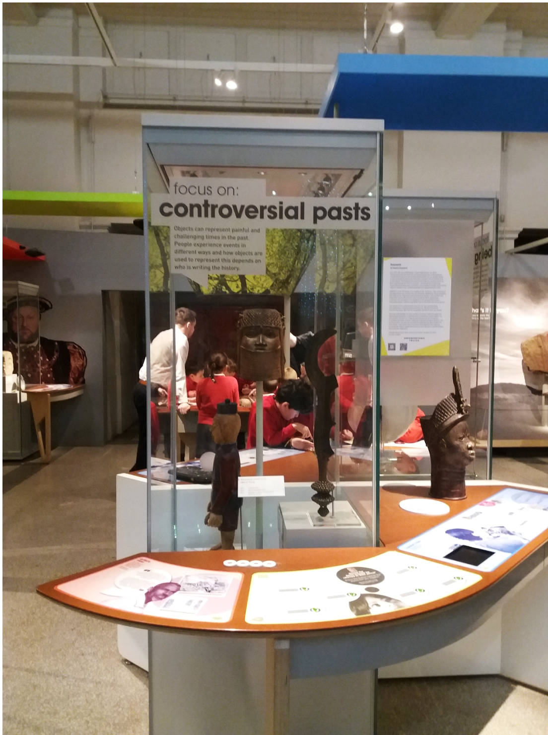
Ill. 1. Accrochage de The Uncomfortable Truths , Tête ancestrale d'un oba ou d'un roi, autour de 1660, Royaume du Bénin, Bristol Museum and Art Gallery, Bristol. Photographie Marine Schütz, mars 2020.