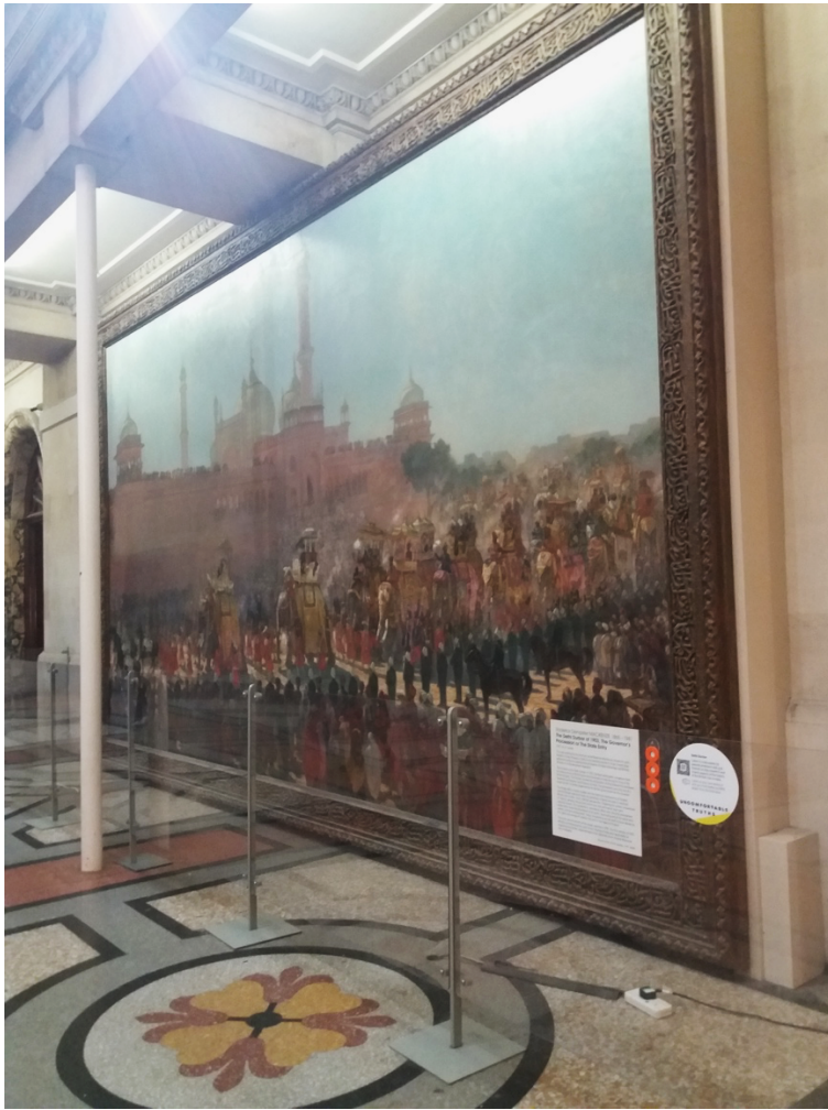
III.2. Roderick Dempster Mackenzie, The Delhi Durbar of 1903, The Governor's Procession or the State Entry , 1907, huile sur toile, Bristol Museum and Art Gallery, Bristol.