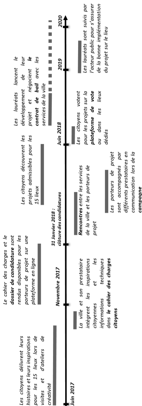
Figure 2 – Représentation chronologique des éléments du dispositif