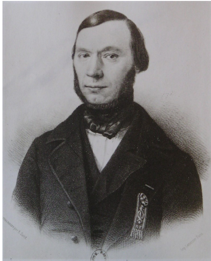
Figure 1 - Portrait de Chazallon issue de la galerie des représentants du peuple (1848)

vitesse du son – Emploi des observations astronomiques. – Formules géodésiques qui paraît en 1837 dans les Annales maritimes et coloniales (t. 1 pp. 323 et suivantes). Chazallon dresse par ailleurs une carte des planisphères célestes spécialement destinés aux officiers de Marine, dessinés et gravés sous la direction de Delamarche 7 . Les procès-verbaux du Bureau des longitudes ne renferment d'ailleurs aucune trace de cette carte. Cela paraît d'ailleurs assez surprenant au regard des missions dévolues au Bureau et de la note explicative accompagnant ces planisphères : « [...] En publiant ces nouvelles cartes nous avons eu principalement pour but d'être utiles aux jeunes officiers de marine ; ils y trouveront toutes les étoiles, jusques et compris celles de 6-7 e grandeur, qui peuvent être occultées par la Lune ».