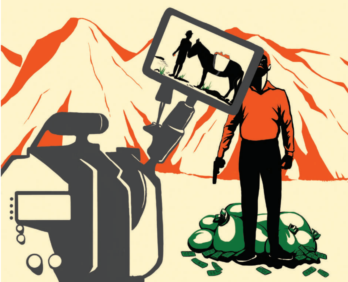
→ Romantisation de la violence , Camille Le Monies de Sagazan, 2020 © PENNINGHEN 2020