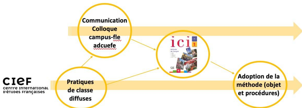
Figure 2 : La co-construction d'un objet pédagogique et de recherche : l'exemple d'un manuel de découverte du milieu homoglotte

Comme le montrent le schéma ci-dessus (figure 2) et le précédent (figure 1), la combinaison entre les interrogations suscitées par la classe et le travail de recherche a suivi un cheminement aboutissant à une transformation sur le terrain de la classe et de ses pratiques, par la production d'un outil pédagogique tentant de répondre aux questions initiales.