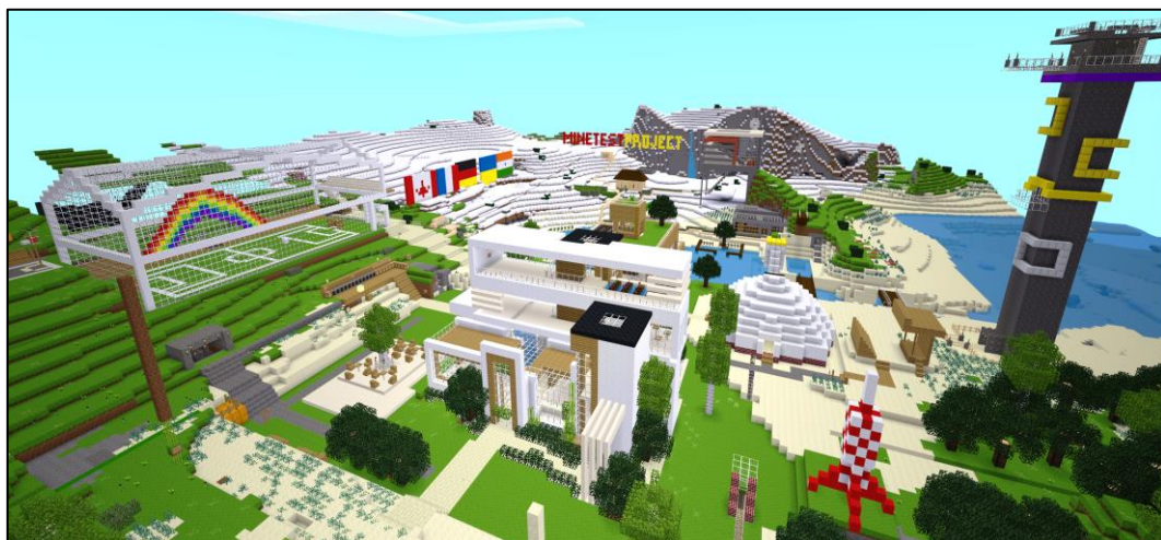
Figure 2. Réalisations effectuées par les trente-sept étudiants dans le cadre du projet international Minetest 2021.