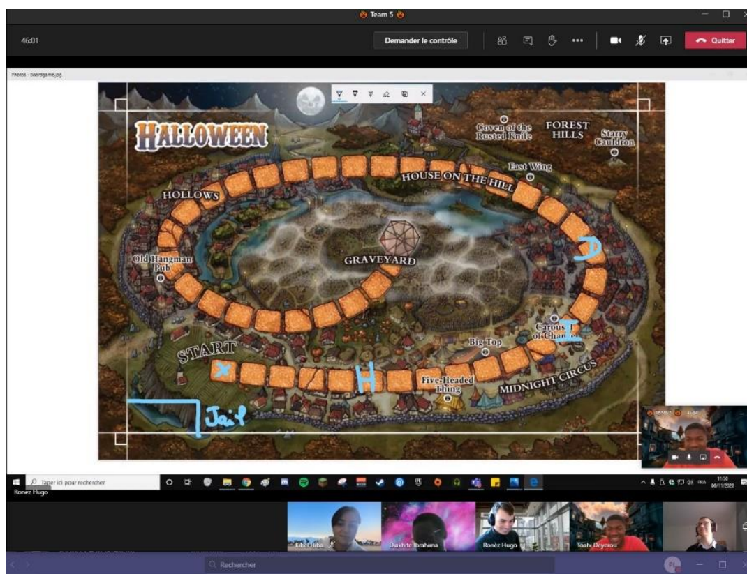
Figure 2. Table virtuelle de JDR dans Microsoft Teams. L'activation des webcams était obligatoire car elles engendrent une interaction plus importante. Nous avons observé que les tables avec des problèmes de connexion (et donc des étudiants sans webcams) fonctionnaient moins bien.

Le nombre d'étudiants ayant participé a augmenté en 2020-2021 puisqu'ils étaient soixante-dix (soixante-six répondants aux questionnaires, soit 94,3% de taux de réponses) alors qu'en 2019-2020 ils n'étaient que quarante-sept (quarante-quatre répondants aux questionnaires, soit