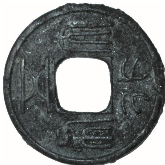
Рис. 3. Китайская монета из некрополя Кудыргэ (Алтай) (по: [3. Рис. 2, 6])

эпохи Первого каганата. Среди имеющихся находок, происходящих из Поднебесной империи, особое место занимает китайская монета, обнаруженная в ходе раскопок могильника Кудыргэ на Алтае [3. Рис. 2, 6; 15. Табл. XXI, 2] (рис. 3). Первоначально монета была датирована 26 г. до н.э. – 220 г. н.э. [15. С. 43; 17. С. 467], но впоследствии ее хронология была уточнена. При публикации материалов некрополя рассматриваемая находка отнесена, со ссылкой на определение известного специалиста А.А. Быкова (однако без представления оснований для такой атрибуции), к 575–577 гг. [15. С. 43]. Экземпляр из Кудыргэ не относится к «у-шу». Монеты указанного типа в целом достаточно единообразны [9. С. 59], хотя китайские специалисты выделяют значительное количество их вариантов [18]. Безусловно, в данном случае все вопросы будут сняты при получении четкого и подробного нумизматического определения. Особенно это важно в связи с тем, что монета из могильника Кудыргэ нередко рассматривается как важный показатель не только для уточнения датировки памятника, но и для определения хронологических рамок кудыргинского этапа культуры тюрков.