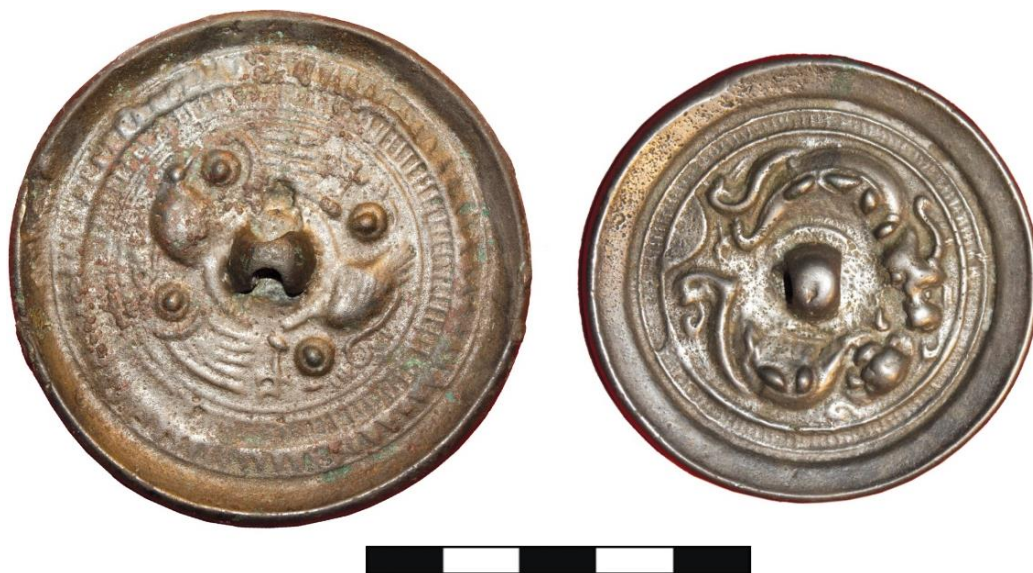
Рис. 4. Китайские металлические зеркала из некрополя Шибэ-II (Алтай) (по: [23. Табл. XXIII, 1; XXIV, 2])

количество нешироких лент, расположенных вокруг центральной шишки-петли и отделенных друг от друга узкими валиками. Не исключено, что представленные находки из тюркских погребений могут являться поздними копиями металлических зеркал. Для уточнения времени изготовления изделий необходим специальный анализ каждого экземпляра, в том числе изучение состава сплава предметов.