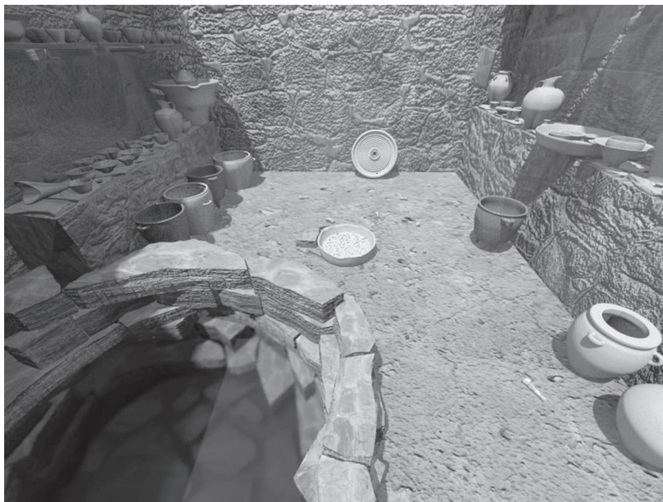
Fig. 2 – Un exemple de rendu photoréaliste. L'« atelier de potier » de Zominthos (Crète, âge du Bronze).

exiger la résolution d'une équation dite integro-differential Radiative Transfer Equation , qui détermine le transport de la lumière dans un participating medium (Glassner 1994). Enfin, il est possible de calculer les ombres à partir d'un point donné en utilisant un algorithme de lancer de rayon ( ray-tracing ).