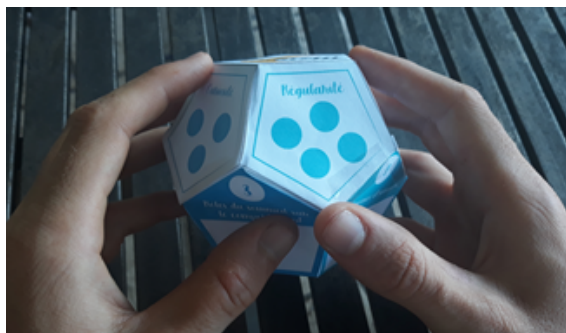
Figure 3 : Objet directement manipulable par les élèves pour explorer la piste C présentée en partie 3

d'expertise comme le proposent Beignon et al. [18] dans leur guide de physicalisation). Nous pouvons également imaginer que l'objet puisse se connecter aux autres élèves ou du moins être réuni dans la classe dans un même endroit. Nous pourrions ainsi visualiser la « barre » de progression collective de la classe. Les enjeux les motivations seraient doublés dépassant le domaine individuel à celui de la classe.