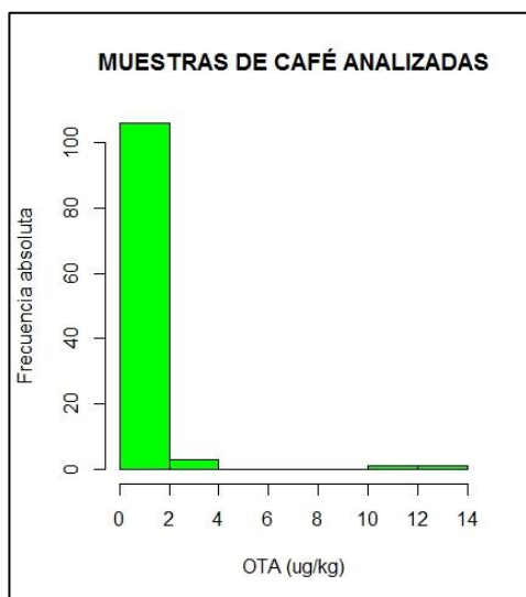
Figura 2. Diagrama de caja y bigotes de las muestras analizadas