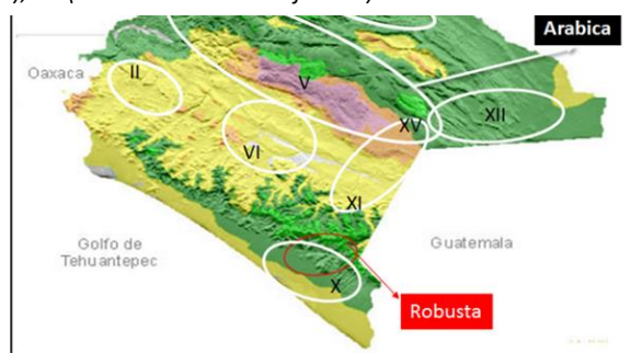
Figura 30. Regiones cafetaleras muestreadas. II (Valle Zoque), V (Altos Tzotzil-Tzeltal), VI (Frailesca), X (Soconusco), XI (Sierra Mariscal), XII (Selva Lacandona), XIII (Maya), XIV (Tulijá Tzeltal-Chol), XV (Meseta Comiteca Tojolabal).

En las Figuras 2 y 3 se presentan el diagrama de caja y bigotes e histograma de las muestras analizadas. Únicamente 3 muestras estuvieron fuera de los límites señalados por la regulación europea, de las cuales todas correspondieron a la variedad arábica y procesadas por la vía húmeda también conocida como beneficiado húmedo; dos de ellas fueron muestras de café tostado y cultivadas convencionalmente en las regiones Sierra y Selva Lacandona, zonas XI y XII de la Figura 1, respectivamente, y una del tipo verde orgánica de la región Meseta Comiteca Tojolabal (zona XV de la Figura 1). En los diferentes reportes bibliográficos, la presencia de OTA está principalmente vinculada con la variedad robusta y el secado natural o al sol, derivado de las condiciones en las que se realiza el tipo de secado. La presencia de OTA fuera de los límites de la norma se puede explicar, debido a casos aislados derivados de un manejo post cosecha inadecuado durante el procesamiento o el almacenamiento, dado que el 97.3% de las muestras cumplen con la regulación europea.