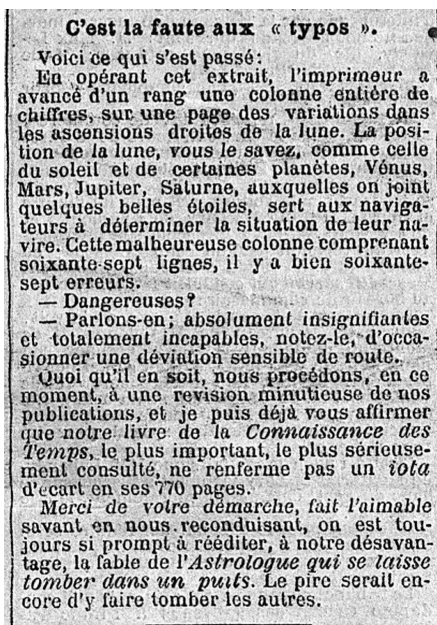
Figure 3 - "Dans la lune", article publié dans le journal Le Matin du 23 janvier 1893, troisième partie

Hervé Faye a dû se fendre d'une lettre au ministre de l'Instruction publique la veille, le 24 janvier 1893, reconnaissant qu'en effet il se trouvait 25 erreurs dans une table de l' Extrait mais qu'elles étaient dues à une erreur de composition typographique et n'engageait en rien la sécurité des navigateurs. Faye ajoutait – de manière opportuniste –, « qu'aucune somme n'étant portée au budget du Bureau aussi bien pour les corrections que pour la publication de l'Extrait, la révision n'a pas été faite successivement par trois ou quatre personnes ainsi que cela a lieu pour la Connaissance des temps 1 [...] ».