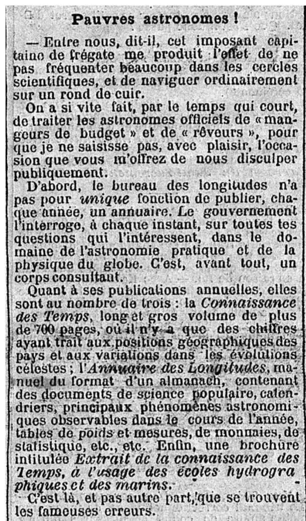
Figure 2 - "Dans la lune", article publié dans le journal Le Matin du 23 janvier 1893, deuxième partie

« Une lettre du Ministre de l'Instruction Publique, rédigée <à la suite> d'une communication du Ministre de la Marine, demande la liste complète des erreurs typographiques contenues dans l'Extrait de la Connaissance des Temps pour 1893, afin qu'une rectification puisse être faite prochainement. M. Bouquet de la Grye explique que les fautes sont sans importance au point de vue de la détermination de la position en mer. D'abord, en Janvier, la colonne des différences des ascensions droites de la Lune a été élevée d'une ligne, et le nombre d'en haut supprimé. Il y a dans un autre endroit, encore pour des différences, un chiffre 2 mis au lieu de 1, quatre fois de suite. M. Bouquet de la Grye, avec l'aide de notre bureau de calculs, va faire vérifier tous les chiffres de l'extrait, et dans 3 ou 4 jours, on pourra répondre au Ministre. »