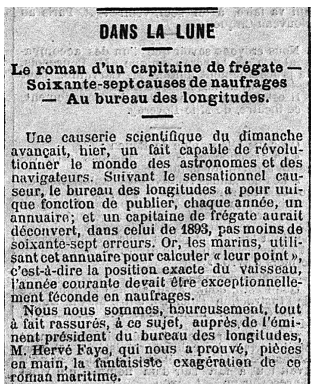
Figure 1 - "Dans la lune", article publié dans le journal Le Matin du 23 janvier 1893, première partie

Les 17 et 23 janvier 1893 paraissent plusieurs articles dans au moins trois quotidiens dont Le Gaulois , Le Figaro et Le Matin . Nous reproduisons certains extraits dans les figures 1 à 3 ci-dessous. Le meilleur extrait indique les « 67 causes de naufrages au Bureau des longitudes », attribuant aux « astronomes mangeurs de crédits » la volonté de rejeter leur responsabilité sur les typographes de la maison Gauthier-Villars qui auraient provoqué des erreurs graves dans les tables du volume de l'Extrait de la Connaissance des temps pour l'année 1893 (Figures 1 à 3 – Extraits du Matin du 23 janvier 1893), mettant potentiellement en danger la vie des navigateurs.