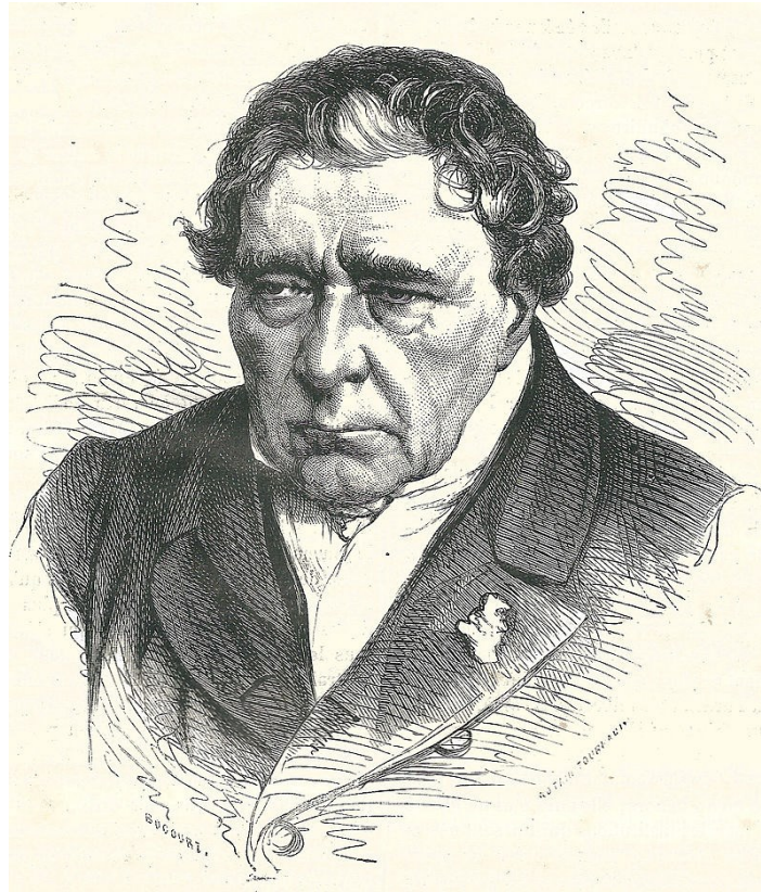
Figure 2 - Portrait de Jacques Babinet (Bocourt & Autain Toureau — Jules Claretie, Histoire de la Révolution de 1870-71 illustrée , Paris : Librairie Polo, 1874, p. 449)

la prédiction du temps vient de la grande variabilité du vent qu'il faudrait pouvoir mesurer sur une échelle très fine et sur de grandes distances. Il reconnaît que la chose n'est pas facile mais faisable à terme.