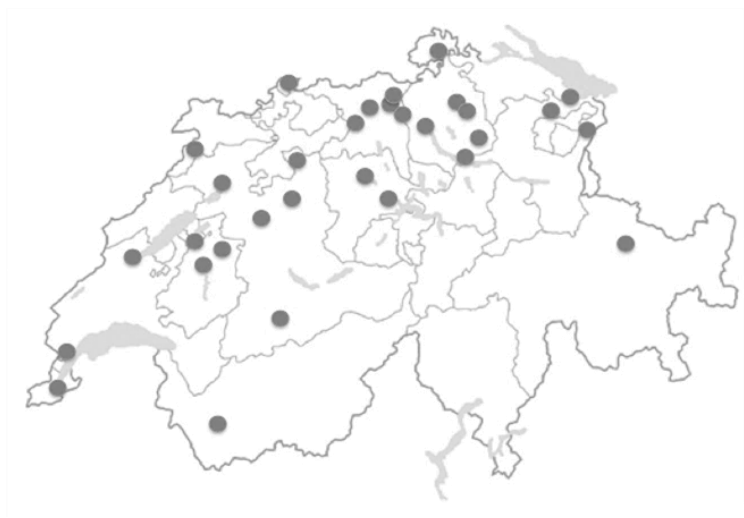
Figure 3 : carte des concerts du groupe Bêta (22 lieux différents)