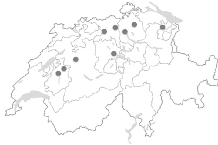
Figure 5 : carte des concerts du groupe Delta (16 lieux différents)