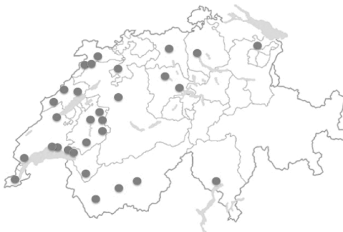
Figure 7 : carte des concerts du groupe Zêta (22 lieux différents)