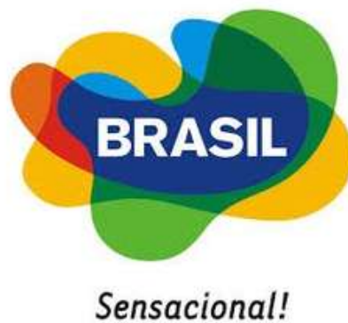
Figure 1: Marque Brésil

La Marque Brésil (Figure 1) correspond à une image créée pour promouvoir le pays sur le marché national et international, ayant été utilisé principalement par Embratur pour l'ensemble des actions conçues stratégiquement 5 .