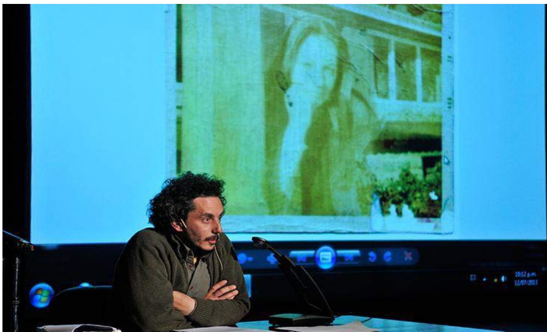
Figura 1 - Campo de Mayo (2013), de Félix Bruzzone

Uma das conferências mais reconhecidas pela crítica na segunda edição da série (2013) foi a do escritor Félix Bruzzone, que em numerosas obras trabalha com procedimentos da autobiografia e do depoimento. Dentro do ciclo curado por Arias, ele lê um texto em processo de escrita cujo personagem principal é um corredor que persegue a figura de sua mãe desaparecida na ditadura. O personagem, Fleje, cujo nome é nitidamente semelhante ao do autor, se muda