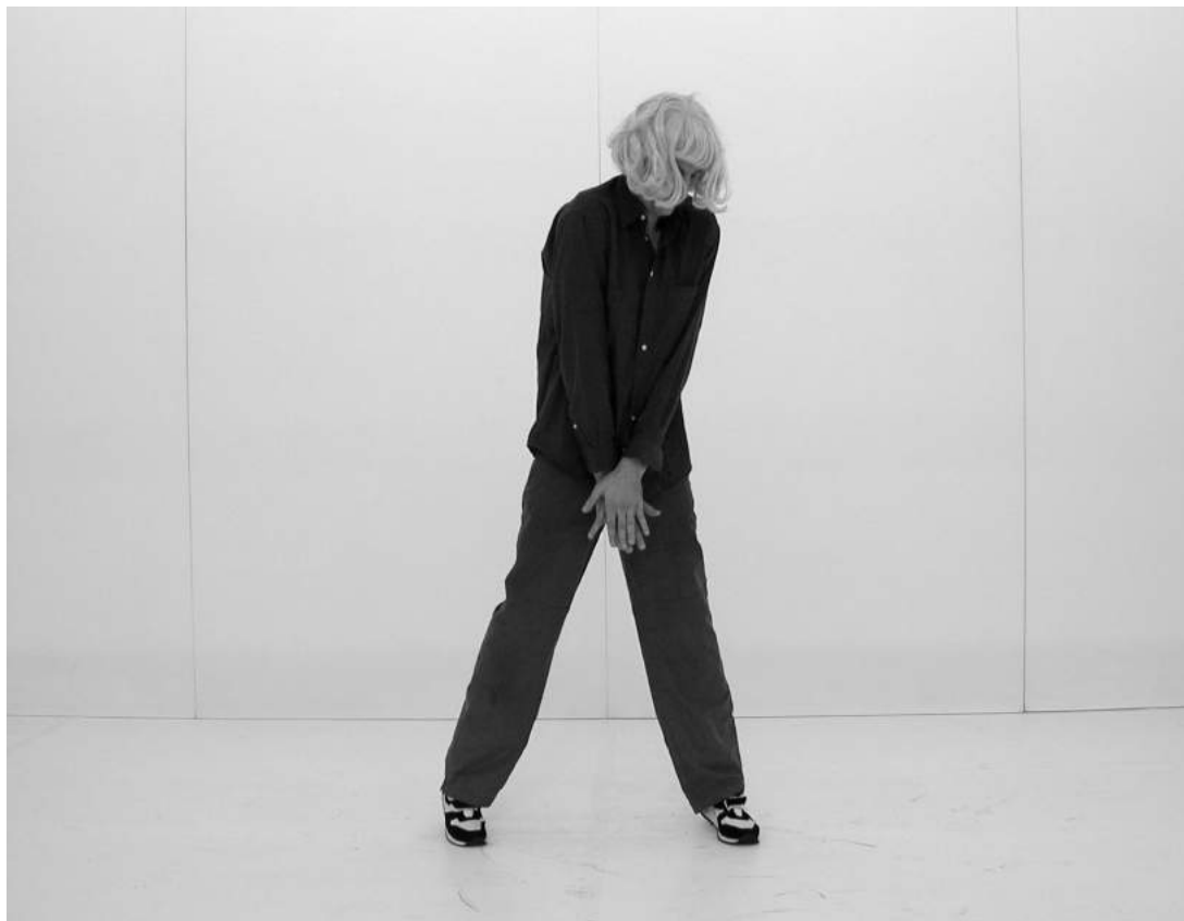
Figura 3 - Xavier Le Roy (2000), RB Jérôme Bel.

O que nos parece intrigante nesse trabalho é que nele a função de Jérôme Bel se aproxima da função curatorial: ao emprestar seu nome para os créditos do espetáculo, além de dar legitimidade à obra, ele propõe que o espectador a considere como parte de um conjunto, no caso, o dos espetáculos assinados por ele.