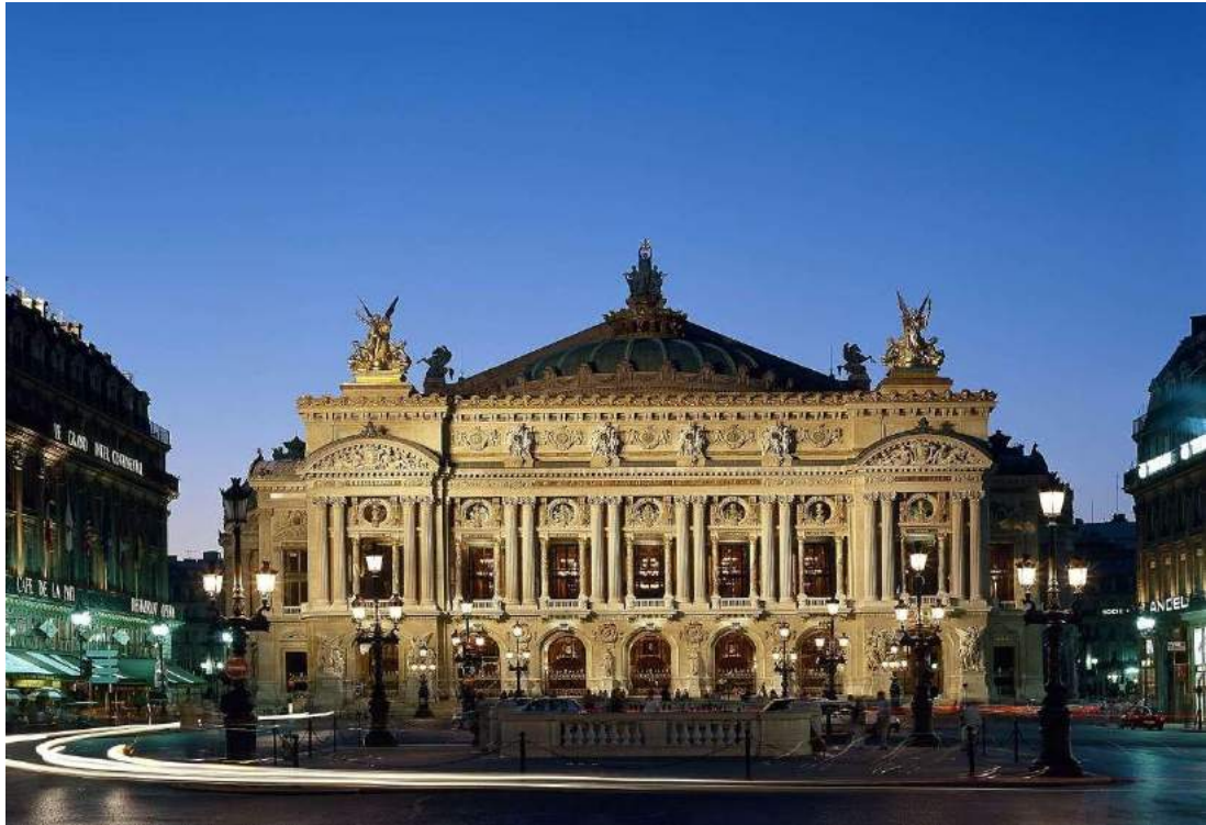
Figura 4 - Fachada do Palais Garnier, prédio da Ópera nacional de Paris.

Cenas como essa instigam à reflexão sobre a carreira artística dentro de uma instituição tão hierarquizada e sobre o fantasma do fracasso que assombra os ofícios criativos. Essa cena certamente evoca a lembrança de uma fala no início do espetáculo na qual ela menciona que nunca se tornou primeira-dançarina: “Não pensei nisso. Acho que não tinha talento o suficiente e era muito frágil fisicamente” 7 . É interessante que Doisneau atribui o fato de não ter chegado ao almejado lugar de protagonismo a ela mesma ou a sua insuficiência (“eu não tinha talento o suficiente”). A instituição ou o elitismo desse tipo de hierarquia não são problematizados. Essa cena é crucial dentro do que Jérôme Bel busca nesses solos. Para ele, fazer um espetáculo na Ópera de Paris passa necessariamente pela necessidade de questionar esse tipo de instituição e o problema do pensamento que a permeia, como a noção de talento, que induz o dançarino a se