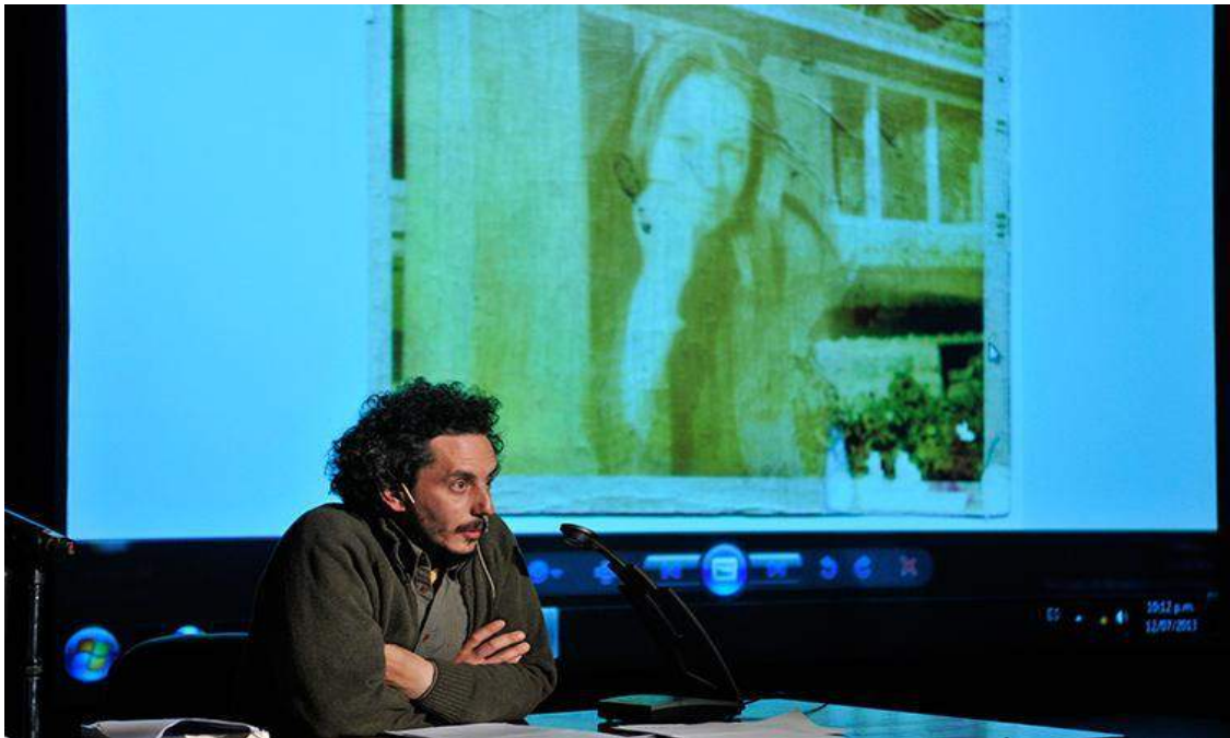
Figura 1 - Campo de Mayo (2013), de Félix Bruzzone

Uma das conferências mais reconhecidas pela crítica na segunda edição da série (2013) foi a do escritor Félix Bruzzone, que em numerosas obras trabalha com procedimentos da autobiografia e do depoimento. Dentro do ciclo curado por Arias, ele lê um texto em processo de escrita cujo personagem principal é um corredor que persegue a figura de sua mãe desaparecida na ditadura. O personagem, Fleje, cujo nome é nitidamente semelhante ao do autor, se muda