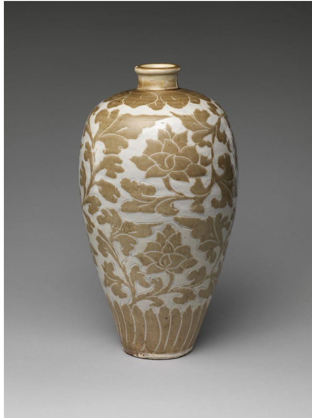
Vase avec mudan, Dynastie Jin (1115-1234), Metropolitan Museum of Art, New York 42

rouge-cramoisi 40 . La « Jaune de Yao » et la « Rouge de Luoyang » avec leurs fleurs doubles avaient marqué le goût des générations d'amateurs et amatrices à venir 41 .