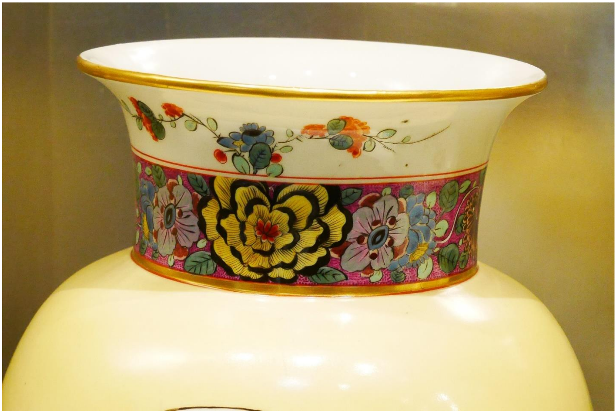
« Vase avec couvercle décoré de fleurs indiennes », Meissen 1725/30[!] 90

Historiquement le mudan était déjà présent en Europe dès le XVI e siècle sous le couvert de l'anonymat 89 : sur de la porcelaine à la cour de Florence, de Paris et de Dresde, ou plus tôt encore dans les familles aisées, partout en Europe, sur des étoffes en soie. Nul ne l'avait identifié comme tel : dans la collection de Frédéric-Auguste I er , à Dresde, où la porcelaine a été « ré-inventée », en Europe au début du XVIII e siècle où on l'appelait « fleur des Indes » ou « indienne » ou fleur « exotique » - car, en réalité, on n'en savait pas plus.