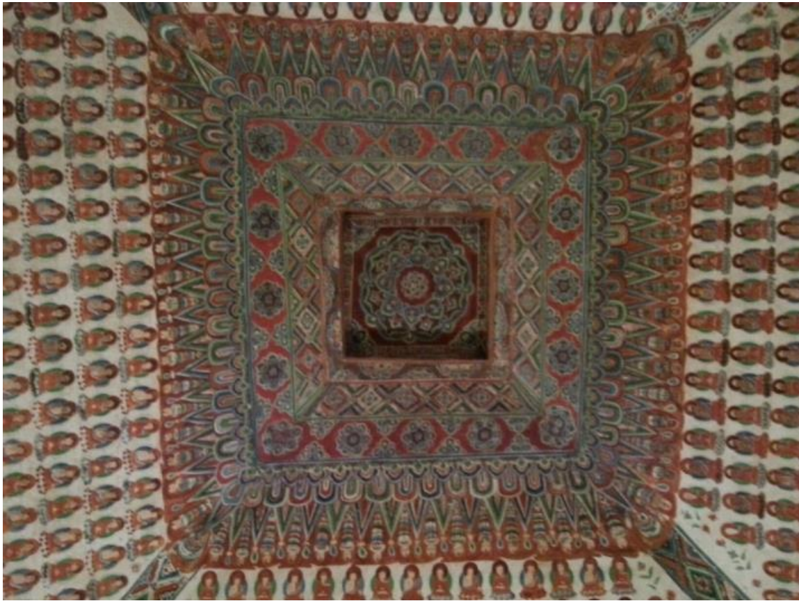
Plafond grotte Mogao n° 320 60

Cette position centrale dans la grotte 320 est emblématique pour ce nouveau rôle dominant du mudan dans la sphère politico-spirituelle de l'époque de Tang sous Xuanzong. Il se peut que l'essor du pouvoir et l'esprit ouvert et multiculturel des Tang ait en même temps mené à un besoin de concentration vers ce qui est une expression authentique 61 de la culture dans la chaîne des dynasties chinoises. Le mudan est issu des plantes sauvages autochtones des montagnes autour du berceau de la civilisation chinoise 62 . Cette origine le prédestinait pour être un symbole chinois par excellence. Le mudan arrivait par conséquent en tête de la symbolique codifiée de la cour. Il détrônait ainsi le lotus comme icône spirituelle ancrée dans la tradition du bouddhisme importé d'Inde.