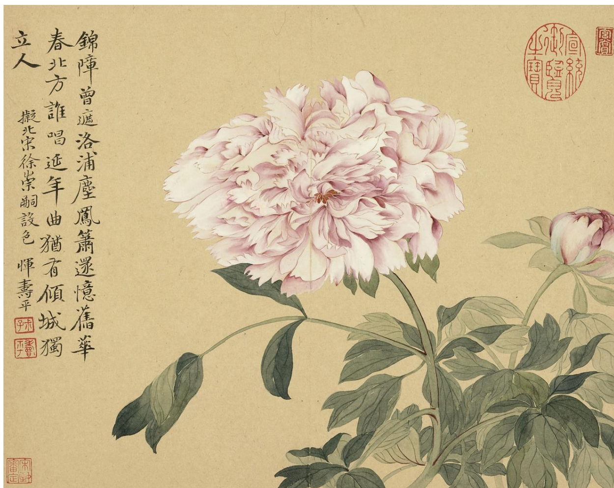
Yun Shouping (1633-1690) 69

Quels sont les traits de caractère attribués à cette image symbolique du mudan ? D'abord la force de la volonté, si l'on se réfère à une histoire de l'impératrice Wu Zetian (de la dynastie Tang, mère de Xuanzong) transmise par le recueil 事物紀原 「牡丹」 shì wù jì yuán 70 « On raconte, un hiver, Wu Hou (Wu Zetian) se promenait dans le jardin arrière (à Chang'an). Toutes les fleurs étaient en floraison, sauf le mudan qui était en retard. Pour cela le mudan fut banni à Luoyang 71 . » Des générations plus tard, cette notice est à l'origine de la légende selon laquelle Wu Zetian aurait demandé à toutes les fleurs de fleurir en hiver et que toutes obéirent sauf une, le mudan. Wu Zetian ordonna alors de la