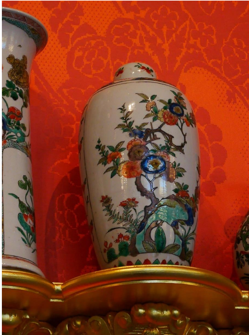
Vase, ère Kanxi (1622-1722) avec mudan, Collection de porcelaine début XVIIIe siècle, Frédéric-Auguste de Saxe, dit « le Fort », Dresde 88

« niveau des idées » – les valeurs et les symboles liés au mudan : l'identité du pays, l'idée de la beauté, la forte volonté et la connotation morale. Les Européens étaient à cet égard proprement « aveugles ». Raison pour laquelle il ne pouvait y avoir de fusion d'horizons, au sens de Gadamer. Bien que regardant la même plante, ils ne pouvaient avoir la même « vision » ou la même conception que les Chinois.