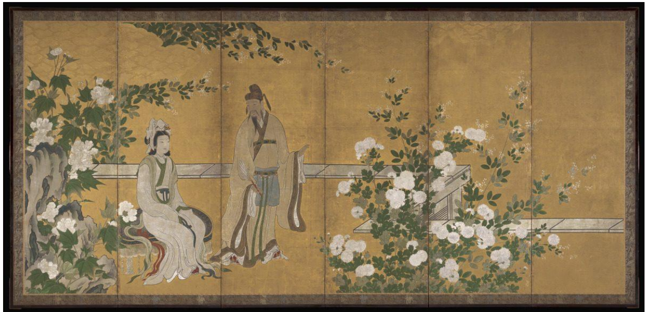
Emperor Xuanzong et madame Yang Guifei au jardin avec des mudan (à gauche) 64