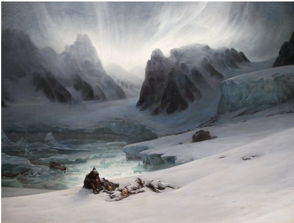
Figure 2 - Magdalena Bay, vue prise de la presqu'île des tombeaux, au nord du Spitzberg ; effet d'aurore boréale, tableau de François Biard pendant l'expédition de 1839, musée du Louvre, Paris

Louis de Freycinet est géologue et géographe, il a participé à l'expédition australe dirigée par le commandant Baudin de 1800 à 1803. Il avait déjà été en contact avec Gaimard pour ses deux premières expéditions en Islande et au Groenland. Il lui avait suggéré alors de faire des observations de météorologie et de marées. La longue liste hétéroclite de ses recommandations pour l'expédition suivante aurait pu occuper une armée de scientifiques pendant quelques décennies... : levée des cartes et des plans, position des phares, température de l'air et de la mer, observations du baromètre et de ses variations diurnes, hauteur des neiges perpétuelles, pluie grêle, neige et grésil, direction et la force des vents, heure d'apparition des étoiles filantes, azimut le plus élevé des aurores boréales, diamètre des arcs-en-ciel et halos, hauteur des vagues. Surtout, il lui demande d'essayer de se procurer les recueils d'observations météorologiques, les manuscrits peu connus, les livres scientifiques importants et « rares ». Voilà de quoi s'occuper pendant les longues nuits d'hiver... D'autant plus que Gaimard aimerait aussi comprendre pourquoi par endroit la côte scandinave s'enfonce sous l'eau ou au contraire se surélève. Ce curieux phénomène avait fait l'objet d'une notice de l' Annuaire du bureau des longitudes pour l'année 1830 par Arago, intrigué, et le navigateur comptait bien trouver des indices ou des récits permettant des mesures plus précises et plus denses.