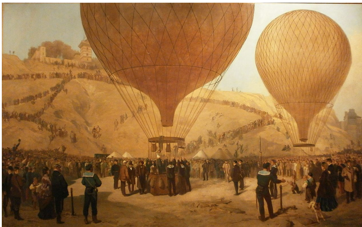
Figure 1 - Jacques Guinaud et Jules Didier, "Départ de Gambetta en ballon Place Saint-Pierre le 7 octobre 1870", musée Carnavalet, Paris

La guerre est déclarée par la France à la Prusse le 19 juillet 1870. Après plusieurs défaites, Napoléon III capitule à Sedan le 2 septembre et la République est proclamée le 4 septembre. Du 17 septembre 1870 au 26 janvier 1871, Paris est assiégé par l'armée prussienne et le seul moyen de s'échapper devient le ballon.