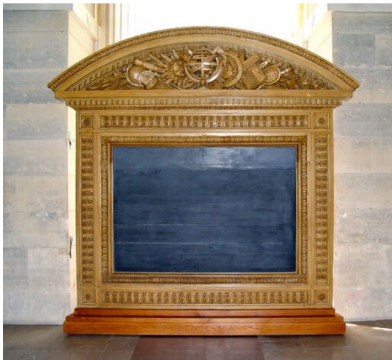
Figure 1 - Tableau noir d'Arago, Alidade-Observatoire de Paris, Inv. 469

En 1911, le célèbre vulgarisateur Camille Flammarion (1842-1925) publie ses Mémoires biographiques et philosophiques d'un astronome , chez Flammarion (maison d'édition de son frère Ernest). S'il ne faut pas prendre pour argent comptant le portrait avantageux que Flammarion dresse de lui-même, il est loisible de le lire – avec circonspection – comme le témoignage d'un acteur du temps.