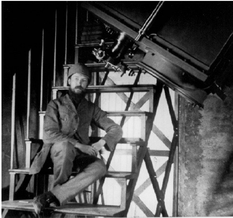
Figure 3 - Fernand Baldet au télescope Benjamin Baillaud en 1909

douter de leur existence, attendu que les Observatoires très bien outillés n'ont jamais réussi à les voir. »