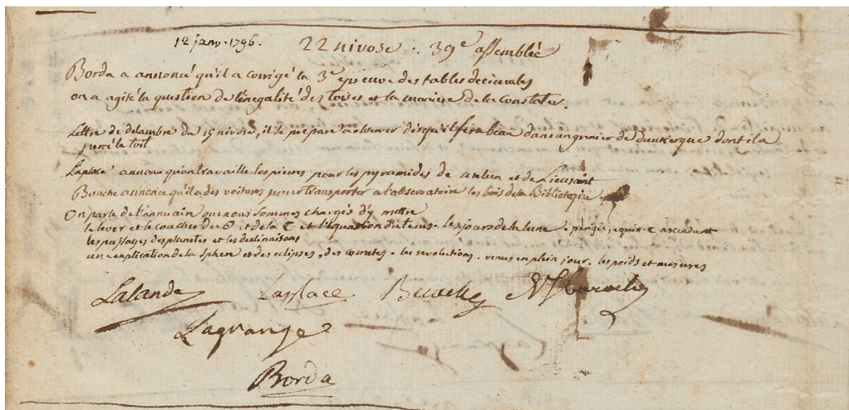
Figure 1 - Procès-verbal du 12 janvier 1796

« On parle de l'Annuaire que nous sommes chargés d'y mettre [sic] : le lever et le coucher du ☉ et de la ☾ et l'équation du tems. les jours de la lune. périégée, équinox. Ascendant les passages des planètes et les déclinaisons une explication de la sphère et des éclipses, des comètes. les révolutions. Vénus en plein jour. les poids et mesures. » (Voir Figure 1)