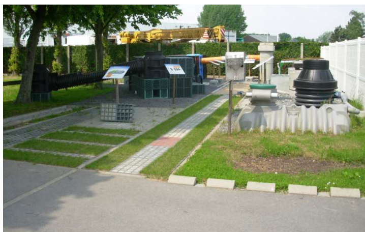
Figure 3 : Le showroom de l'ADOPTA - La boîte à outils des techniques alternatives

Enfin, il ne saurait être question de passer sous silence un autre intérêt et bénéfice de ces techniques alternatives, pour rester dans le cadre de ce dérèglement climatique. Basée sur le stockage de la pluie avant de la gérer, la gestion de ces eaux de pluie est bien moins sensible aux intensités de pluie. Que celle-ci tombe en un quart d'heure ou en trois heures, si elle est stockée, elle ne pose aucun souci vers l'aval, et son écoulement par infiltration ou par débit limité vers un exutoire superficiel est intégré dans les calculs de temps de vidange. Les techniques alternatives reposent sur le stockage des eaux pour réguler les débits et réduire les vitesses d'écoulement en favorisant l'infiltration. Dans l'assainissement classique, les ouvrages sont tous dimensionnés par rapport à une intensité maximale. Celle-ci dépassée, c'est l'inondation qui guette... Aussi, la CAD a pu constater au travers de ses différentes réalisations sur l'ensemble de son territoire une absence d'inondations pour les bassins versants gérés en techniques alternatives. Forts de cette bonne gestion, nos territoires deviennent plus résilients.