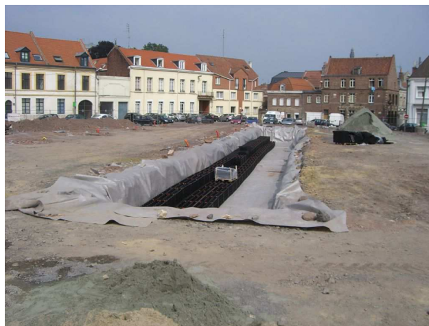
Figure 2 : Place Saint Amé à DOUAI accueillant le marché aux légumes du samedi