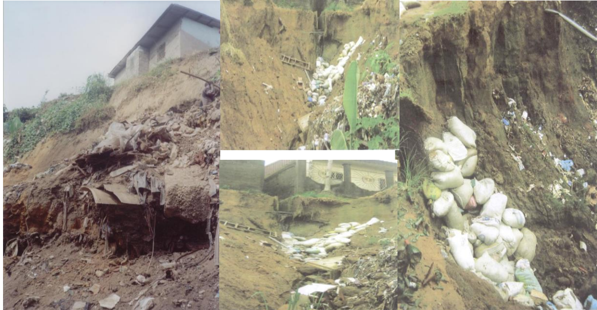
Planche de photos 3 : Illustration des processus d'érosion, de ravinement et d'effondrement des sols urbains avec déchaussement des maisons sous l'effet des eaux pluviales.

routes même bitumées par des eaux pluviales sont exacerbés par la nature pédologique du substrat. Ce substrat est constitué d'un sol à dominance sablo-argileux couvrant plus des \frac{3}{4} de la superficie de la ville (Fouda M., Meva'a Abomo D., 2004). Ce sol se caractérise par une texture poreuse, non-compact ou fragile, et donc, vulnérable à une forte pluviosité. Il en résulte des éboulements, des glissements et affaissements de terrain (planche de photo 3). La réponse socio-spatiale se caractérise par des renforcements des aménagements ou des réaménagements qui ne régulent malheureusement pas la dynamique érosive.