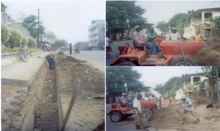
Planche de photos 2: Illustration de l'entretien municipal des rigoles au niveau du centre de la ville et mise en évidence des activités de récupération des déchets curés des sous-traitants