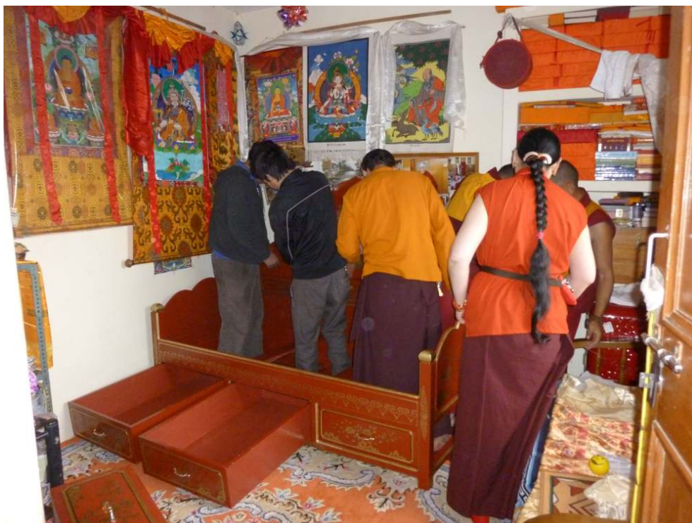
Cliché Nicola Schneider, 2011