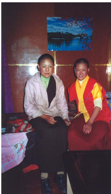
Cliché Nicola Schneider, 2003

ILL. 2 – Une fille qui s'apprête à devenir nonne et qui s'est déjà rasé la tête (à gauche) et une novice (à droite)