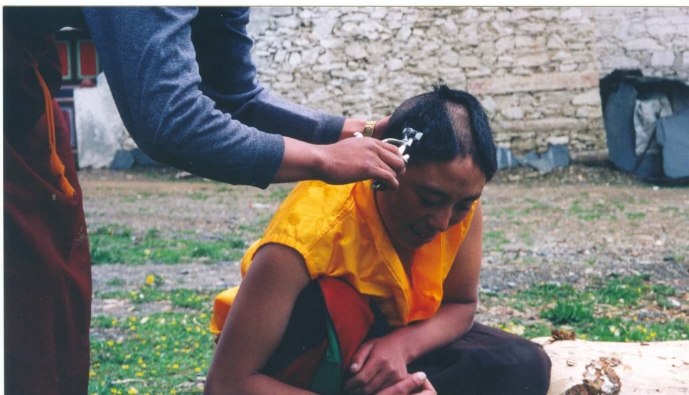
Cliché Nicola Schneider, 2002