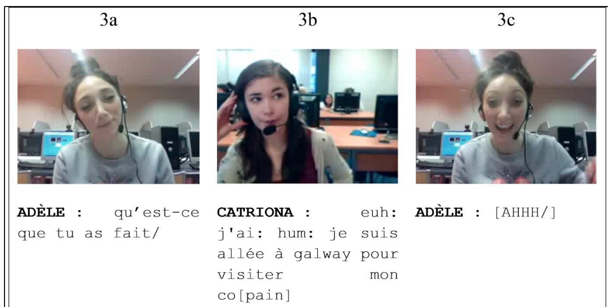
Figure 2 : Corpus écologique d'interaction didactique en visio-conférence (« Corpus ISMAEL », Guichon & Tellier, dir., 2017, p. 45)

Par ailleurs, l'évolution de la didactique des langues a ouvert la voie à l'analyse d'autres situations d'enseignement-apprentissage, telles que les situations médiatisées par les technologies, notamment en visio-conférence (Guichon, 2013). La capture d'écran dynamique permet d'enregistrer les deux ou trois participants à l'interaction didactique en toute discrétion (ce qui n'est pas le cas lorsque l'on place une caméra dans une salle de classe) (Figure 2) et rend ainsi possible l'exploitation de corpus nouveaux.