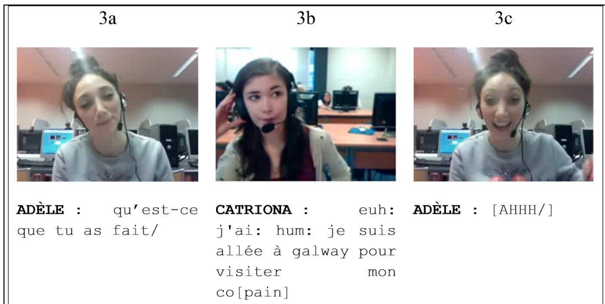
Figure 2 : Corpus écologique d'interaction didactique en visio-conférence (« Corpus ISMAEL », Guichon & Tellier, dir., 2017, p. 45)

Par ailleurs, l'évolution de la didactique des langues a ouvert la voie à l'analyse d'autres situations d'enseignement-apprentissage, telles que les situations médiatisées par les technologies, notamment en visio-conférence (Guichon, 2013). La capture d'écran dynamique permet d'enregistrer les deux ou trois participants à l'interaction didactique en toute discrétion (ce qui n'est pas le cas lorsque l'on place une caméra dans une salle de classe) (Figure 2) et rend ainsi possible l'exploitation de corpus nouveaux.