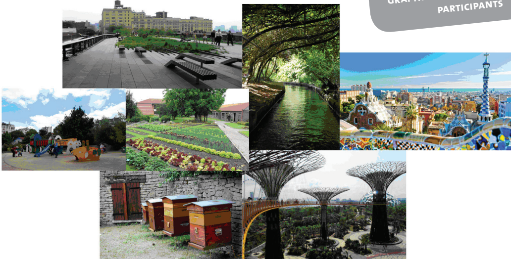
FIGURE 2 : PATCHWORK DE PHOTOGRAPHIES SÉLECTIONNÉES PAR LES PARTICIPANTS