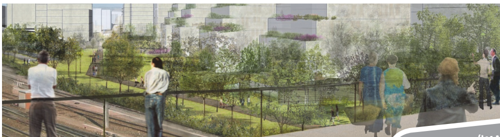
FIGURE 5 : (IMAGE JM DUTHIEUL, AREP VILLE, 2013)

Au delà de l'aspect pédagogique des potagers, nous pourrions penser à l'implantation d'espaces privés mais partagés par les habitants des bâtiments. Les jardins partagés favorisent le cadre de vie par l'apport d'une alimentation plus saine, l'échange avec le voisinage et l'ouverture et l'agrandissement de l'espace privé.