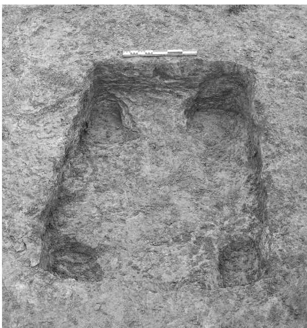
Fig. 2 : Villemoustaussou. La fosse 2201 vidée.

d'une telle lecture. Les quatre poteaux ont probablement soutenu une superstructure, en bois. Ce type d'aménagement agricole ou artisanal appelle des parallèles connus sur des sites ruraux du haut Moyen Age en Ile-de-France, où l'on a proposé de voir des fosses d'ancrage de pressoir. De tels équipements sont connus dès l'Antiquité tardive mais ils mettent en jeu des excavations complexes, qui restent absentes à Villemoustaussou, peut-être en raison de l'arasement des niveaux (Deprataère-Dargery, Petit dir. 1993, 190 ; Couturier dir. 2003, 93-97).