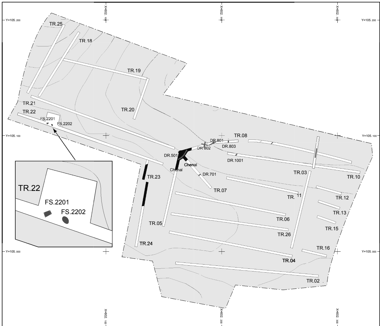
Fig. 1 : Villemoustaussou. Détail du plan du diagnostic présentant les structures FS 22.01 et FS 22.02.