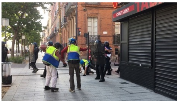
Un observateur est de nouveau matraqué et tombe au sol