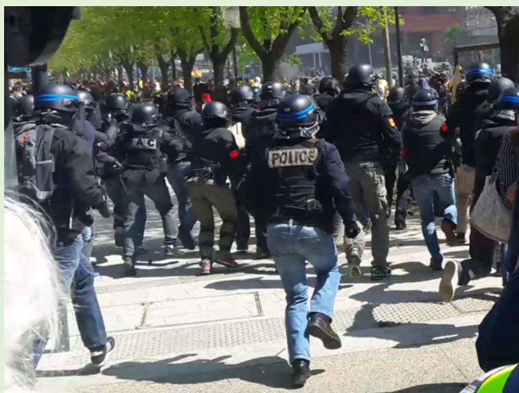
Policiers de la BAC chargeant au cœur d'une nasse lors d'une manifestation à Toulouse Allées Jean Jaurès – Avril 2019