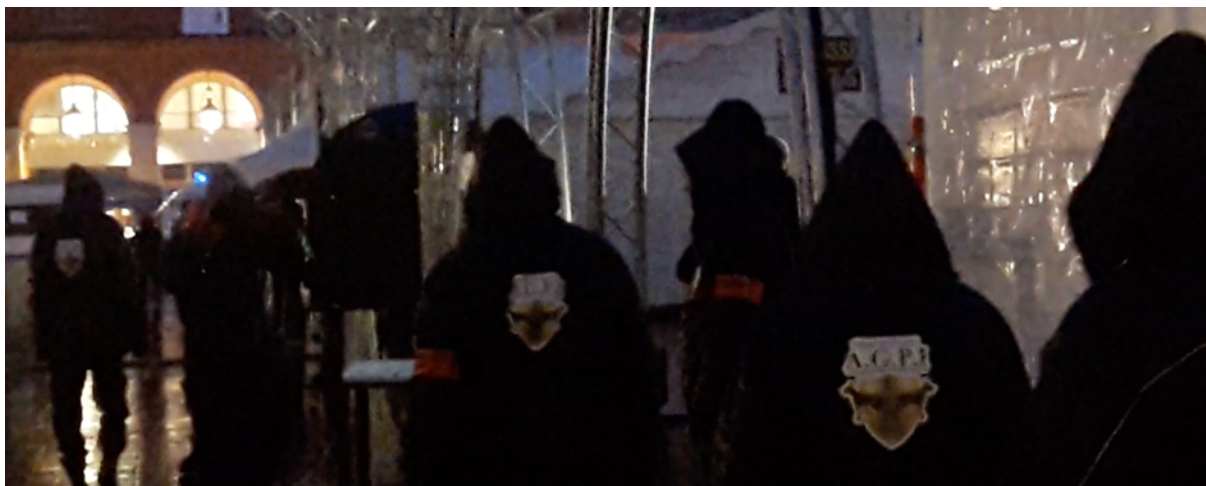
Des agents d'une société de sécurité publique en compagnie de policiers toulousain de la BAC (repérables grâce à leur brassard orange) lors d'une manifestation des Gilets jaunes le 15 décembre 2018, place du Capitole à Toulouse

Ce constant développement du recours à des sociétés de sécurité privées avec l'élargissement de leurs prérogatives (comme la fouille de sacs ou bien la palpation des personnes) place celles-ci dans ce que certains appellent le « continuum de sécurité » ; ce qui veut dire en fait, comme cela est indiqué sur le site Public Sénat 18 que : « La vigilance et la sécurité ne sont plus seulement l'affaire des policiers nationaux, gendarmes ou militaires ». Voilà qui est clairement dit.