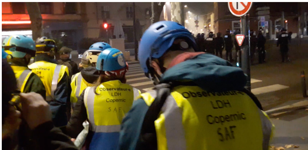
Les observateur-es en position après avoir subi un jet de grenade ciblé – Boulevard Carnot à Toulouse – 17 novembre 2020

Cette agression contre les observateur-es a conduit à une rencontre, le 31 mai 2018, avec la DDSP – Direction départementale de la sécurité publique et la préfecture lors de laquelle il a été décidé, d'un commun accord, que la présence des observateur-es serait systématiquement déclarée en préalable à toute observation des pratiques policières. A ce jour, depuis le 25 octobre 2018, près de 130 déclarations ont été envoyées en préfecture.