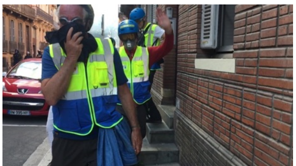
Après sommations, rien que pour eux, les observateurs se replient