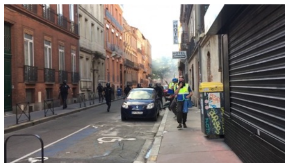
Les CSI chargent et matraquent les observateurs dont l'un est au sol