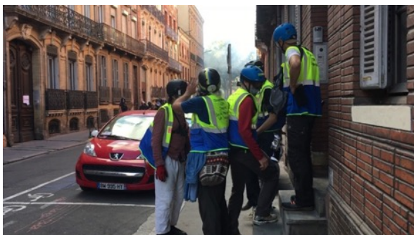
Les observateurs sont regroupés, sur le trottoir