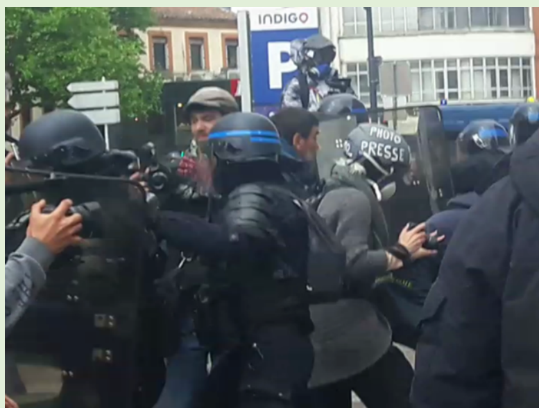
Un groupe de policiers des CSI – Compagnies de sécurisation et d'intervention en action contre des journalistes et reporters - Toulouse – Place Arnaud Bernard - Janvier 2020