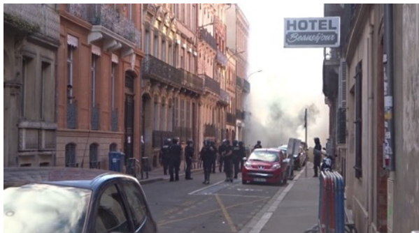
La rue Cafarelli est vierge de tout manifestant

Les images, ci-dessous, issues des deux vidéos précitées permettent de prendre connaissance de cette agression sur les observateurs.