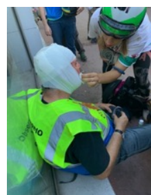
Photos des observateurs blessés : 1 - par un projectile non identifié, 2 - par une balle de LBD, 3 - par un jet de gaz lacrymogène en pleine face, 4 - par une chute durant une charge des « bacqueux »

Cette violence envers les observateur-es, qui n'avait nullement été anticipée lors de la création de l'observatoire, a conduit les observateur-es à s'équiper de matériels de protection individuelle (casques, masques à gaz, lunettes de protection, sérum physiologique) ; ceci au grand étonnement de nombre de militant-es « historiques », de la LDH par exemple, peu habitué-es à voir des militant-es des droits de l'Homme se faire violenter par la police lors de leurs activités sur le terrain.