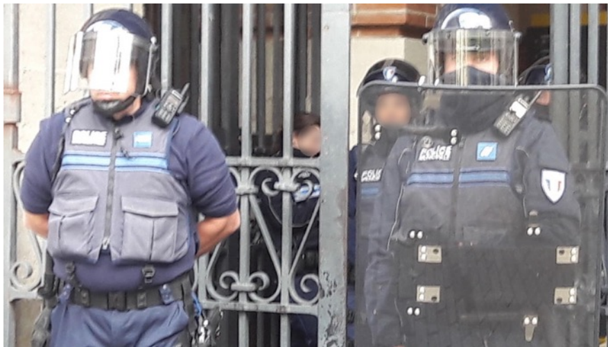
Policiers municipaux casqués et dotés de boucliers, en position à l'une des entrées de la mairie de Toulouse, square Charles de Gaulle, le 18 mai 2019. A noter que l'un des policiers, doté d'un bouclier, est aussi cagoulé...

Les dispositifs de la loi LSG élargissent , dans un cadre encore expérimental concernant les collectivités employant plus de 15 policiers municipaux, le champ des compétences des polices municipales qui verront désormais leurs prérogatives largement augmentées 16 . Nous n'évoquerons pas ici l'ensemble des mesures (le lecteur peut pour cela se reporter aux décriptages effectués par ailleurs de la loi LSG ; on peut, par exemple, évoquer la possibilité d'utilisation de drones et caméras-piéton) mais souhaitons mettre en valeur les constats que nous avons effectué à Toulouse dans le cadre d'opérations dites de « maintien de l'ordre » ; et ceci bien avant la « séquence des Gilets jaunes ». Nous avons constaté plusieurs fois (entre autres les 8 décembre 2018 et 18 mai 2019 – photo ci-dessous - selon les rapports internes de l'OPP) la présence de policiers équipés pour le maintien de l'ordre.