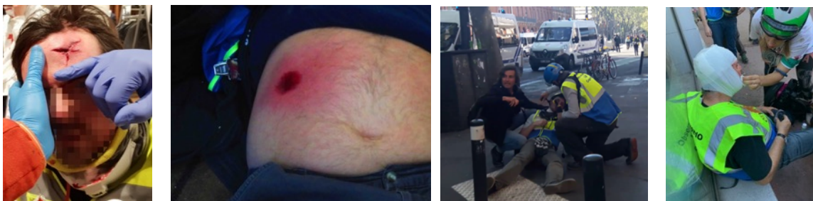
Photos des observateurs blessés : 1 - par un projectile non identifié, 2 - par une balle de LBD, 3 - par un jet de gaz lacrymogène en pleine face, 4 - par une chute durant une charge des « bacqueux »

Cette violence envers les observateur-es, qui n'avait nullement été anticipée lors de la création de l'observatoire, a conduit les observateur-es à s'équiper de matériels de protection individuelle (casques, masques à gaz, lunettes de protection, sérum physiologique) ; ceci au grand étonnement de nombre de militant-es « historiques », de la LDH par exemple, peu habitué-es à voir des militant-es des droits de l'Homme se faire violenter par la police lors de leurs activités sur le terrain.