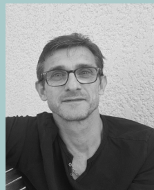
Sylvain Kerbourc'h Sociologie ♦ CEMS, Paris, France

Cette contribution explore la question des inégalités de santé d'une population échappant aux études statistiques nationales françaises, en raison notamment de son poids démographique réduit. Elle est issue d'une étude exploratoire plus large, interdisciplinaire, visant à saisir la diversité des expériences et des parcours de vie au sein de cette population. La question du rapport aux soins et aux soignants, et celle du rapport au corps et à la santé, étaient des sujets parmi d'autres de l'étude. Elles se sont révélées fortement imbriquées à d'autres dimensions et d'autres échelles dont notre contribution étudie l'encastrement dans la fabrique sociale d'inégalités de santé d'une minorité.