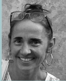
Anne-Lise Granier Anthropologie ♦ LISST, Toulouse, France