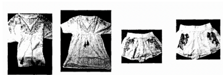
Modèles du défendeur