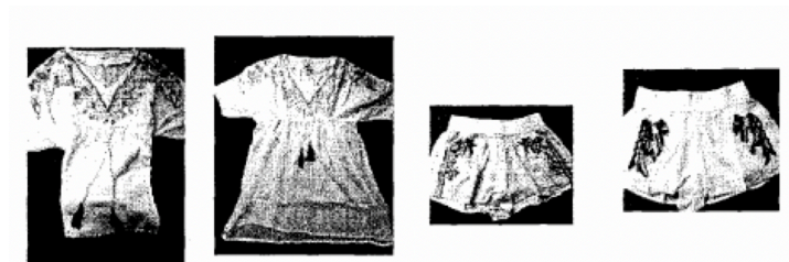
Modèles du défendeur