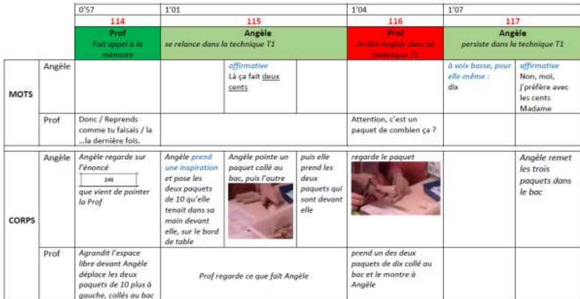
Tableau sémiogénétique lignes 114-121