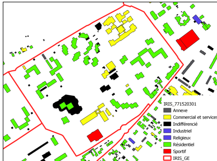
Figure 1 : carte du cas d'étude N°3 issue de la BDTOPO.