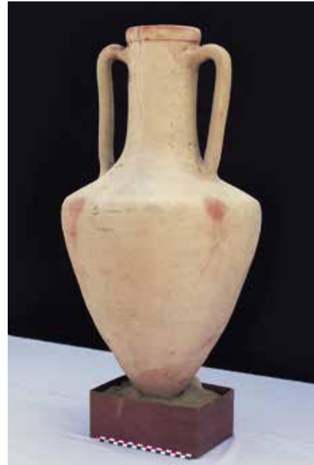
Fig. 11. An intact amphora from S37 of Philadelphia, a variant of AE1 type.

11 artefacts have entered the Kom Aushim register: five Ptolemaic coins (from S15), an amphora stamp seal (from S37), a brass weighing weight (from S38), a pair of weaving weights (from S40), a limestone relief of a feminine figure (from S13), a limestone tablet for arranging tools (from S38), and finally an AE1 amphora completely preserved, with a stamped neck (from S37). Amphora stamps are particularly abundant, including at least 4 types. A few ostraca were found, of which at least 3 carry Greek texts. A few fragments of a cartonnage were also unearthed (S37); a Greek name ending in -ηϋς can be read on one of them; the writing may be dated to the 1st century AD. All these objects have been restored as need be.