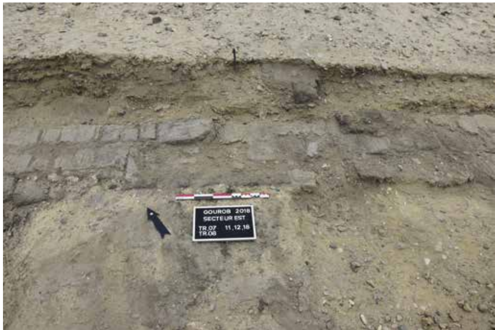
Fig. 3. Détail des briques crues du mur sud.

Quatre sondages ont été mis en place sur le mur sud (sondages 06 à 10) sur une longueur totale de 18 m. La largeur du mur sud est la même que celle des murs est et nord (2,40 m). L'agencement de la construction de la fondation est très intéressant : deux alignements de briques crues (fig. 3) ont été mis en place de chaque côté de la tranchée de fondation, avec un remplissage au milieu, afin d'obtenir une surface plane au niveau de la fondation. Il ne reste que deux rangées de briques de terre dans certaines parties du mur sud. Nous avons remarqué la présence d'une épaisse couche de mortier sous le premier rang de la fondation et au-dessus, où l'on peut facilement distinguer les traces du second rang.