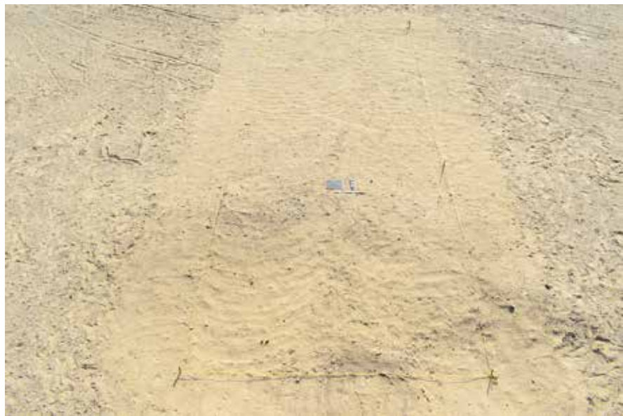
Fig. 4. Délimitation du sondage NS01 dans le secteur ouest.

En essayant de comprendre la chronologie entre le « fort » et la zone du palais, nous avons implanté une tranchée ( 10 \times 4 m) pour localiser le mur d'enceinte nord du harem (fig. 4). Au cours du nettoyage de surface de cette tranchée, la couche supérieure, constituée de sable jaune tendre avec de petits éclats de poterie, se trouve directement sur une couche de sable gris compacté. Nous avons été contraints de nous y arrêter, pour des raisons administratives. Cette couche est un signe prometteur pour localiser le mur nord. Si l'autorisation de travailler dans ce secteur nous est accordée la saison prochaine, nous pourrions mieux comprendre la relation entre le « fort » et la zone du palais.