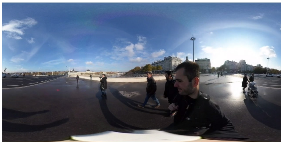
Vidéo 3 – Extrait « Les berges », vue 360° immersive. Entretien réalisé le 19 novembre 2019 à Lyon

Si une première modalité de vue à 360° est une vue à l'intérieur de laquelle il est possible de naviguer (vidéo 3), une deuxième modalité permet de reconstituer la trajectoire du discours (vidéo 4).