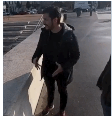
Image 4d – Captures d'écran de l'extrait « Les Berges ». Entretien réalisé le 19 novembre 2019 à Lyon

progressivement une nouvelle orientation des corps dans l'espace pour initier une redirection vers les berges du Rhône en question.