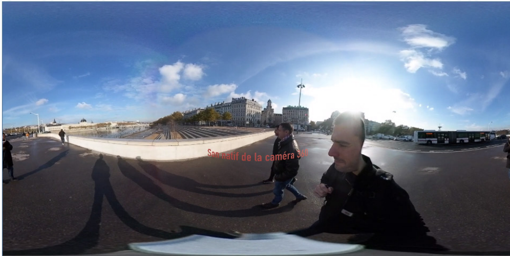
Vidéo 1 – Extrait « Les berges », vue externe. Entretien réalisé le 19 novembre 2019 à Lyon © UMR 5191 ICAR

de l'entretien déambulé, mais également celle du dispositif éprouvé. À l'aide d'un pied steadicam , le groupe a été filmé lors des déambulations, avec la consigne de se focaliser sur le groupe, de face.