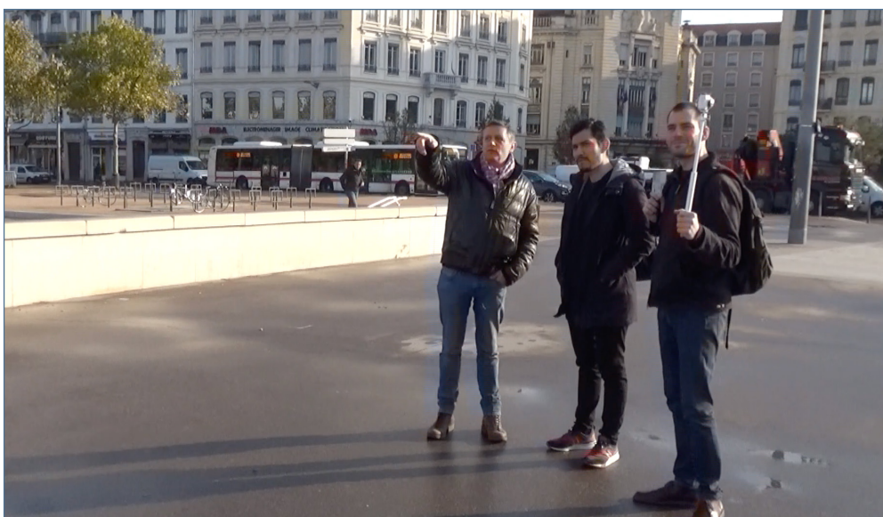
Image 4a – Capture d'écran de l'extrait « Les Berges ». Entretien réalisé le 19 novembre 2019 à Lyon

L'échange est alors ponctué par un silence de quelques secondes, le temps que l'étudiant nous propose de s'orienter vers un autre lieu en contrebas du pont: les berges du Rhône (ligne 25). Comme on peut le remarquer à travers la capture d'écran 3 (image 4c et image 3, ligne 26), un geste de pointage de l'étudiant déclenche