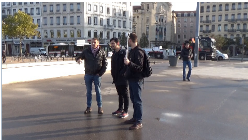
Vidéo 2 – Extrait « Les berges », vue externe. Entretien réalisé le 19 novembre 2019 à Lyon

À partir d'un extrait du corpus, nous pouvons illustrer et questionner la gestion collective de l'interaction par les participants. Dans ce parcours élaboré par l'étudiant (voir supra ), le groupe se dirige du quartier de la Guillotière vers le quartier du Vieux-Lyon. L'extrait que nous allons étudier (vidéo 2) se situe à l'arrivée du groupe sur le pont de la Guillotière. Dans l'analyse, nous allons d'abord nous intéresser à la manière dont les chercheurs et l'étudiant négocient un discours sur la ville. En recourant à une transcription du discours en interaction dans