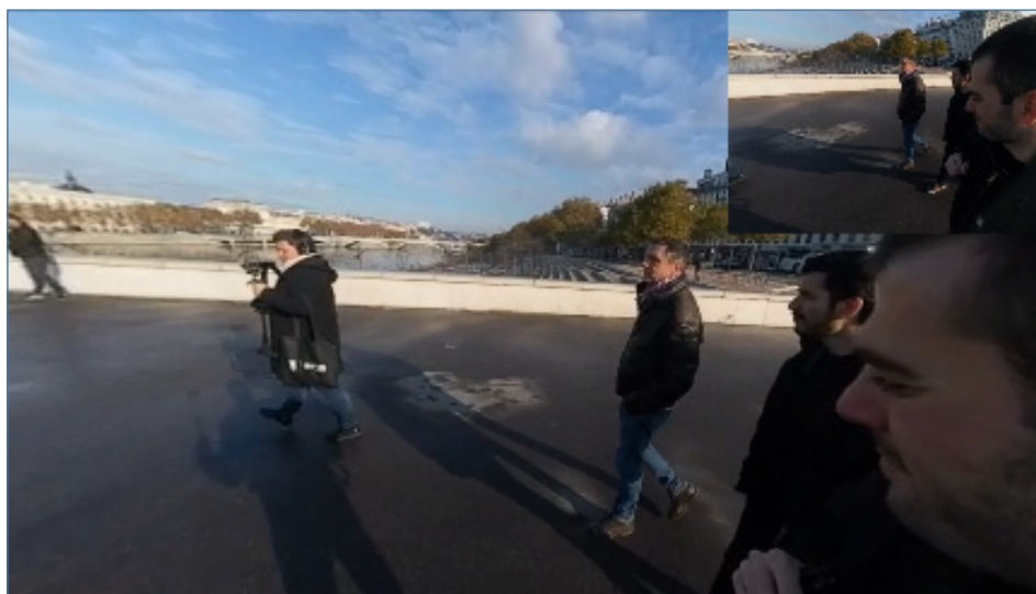
Vidéo 4 – Extrait « Les berges », vue trajectoire discursive. Entretien réalisé le 19 novembre 2019 à Lyon