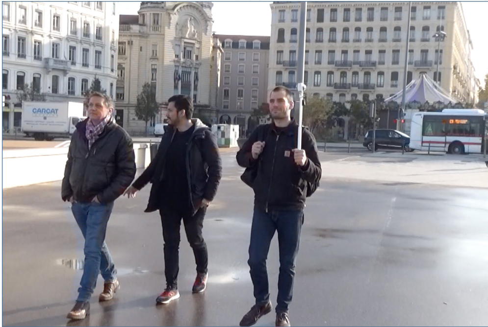
Image 4c – Capture d'écran de l'extrait « Les Berges ». Entretien réalisé le 19 novembre 2019 à Lyon