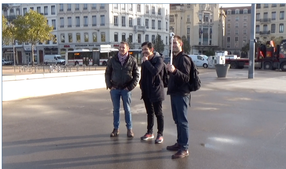
Image 4b – Capture d'écran de l'extrait « Les Berges ». Entretien réalisé le 19 novembre 2019 à Lyon