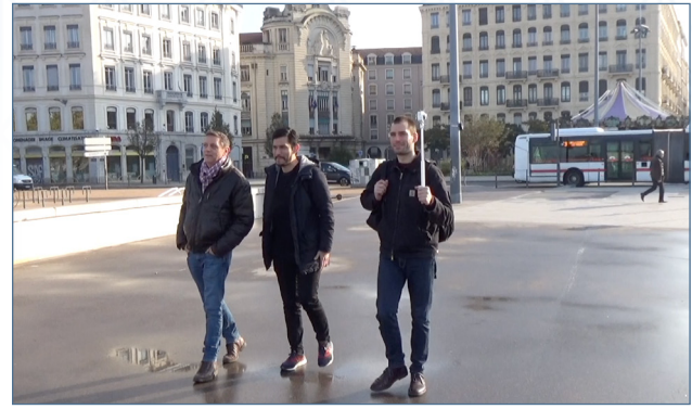
Image 1 – Dispositif de captation avec vue 360° (gauche) et vue externe (droite). Captures d'écran de l'entretien réalisé le 19 novembre 2019 à Lyon

écologique, il s'agit alors de rendre compte des liens consubstantiels entre l'accomplissement d'un cours d'action et la transformation d'une situation sur les plans actoriel (les rôles sociaux joués et négociés par des individus), spatial (la définition d'un espace approprié à une pratique en cours) et temporel (les dynamiques de projection dans le temps). Avant de présenter le dispositif de captation audiovisuelle 2 , il convient d'explicitier les différentes étapes qui constituent notre enquête.