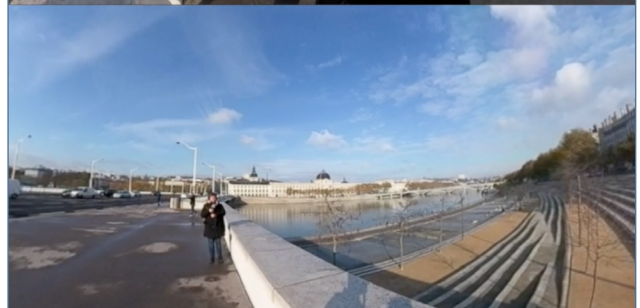
Image 2 – Dispositif de captation avec vue 360° (gauche) et vue externe (droite). Captures d'écran de l'entretien réalisé le 19 novembre 2019 à Lyon