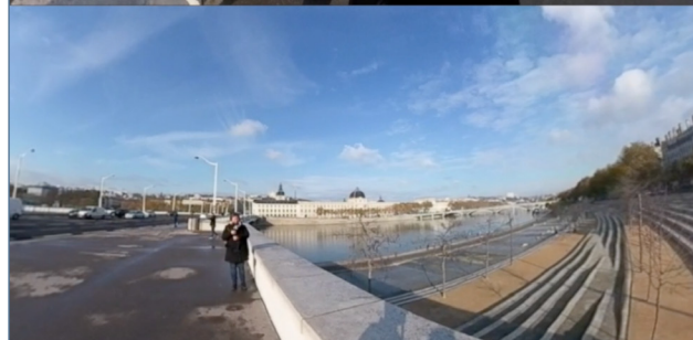
Image 2 – Dispositif de captation avec vue 360° (gauche) et vue externe (droite). Captures d'écran de l'entretien réalisé le 19 novembre 2019 à Lyon