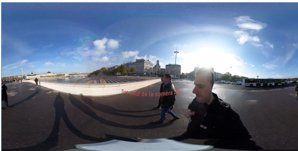
Vidéo 1 – Extrait « Les berges », vue externe. Entretien réalisé le 19 novembre 2019 à Lyon

de l'entretien déambulé, mais également celle du dispositif éprouvé. À l'aide d'un pied steadicam , le groupe a été filmé lors des déambulations, avec la consigne de se focaliser sur le groupe, de face.