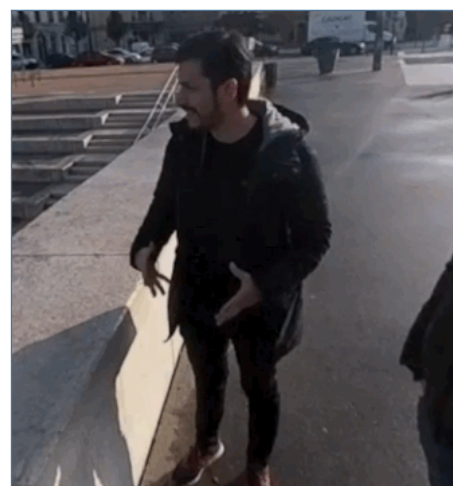
Image 4d – Captures d'écran de l'extrait « Les Berges ». Entretien réalisé le 19 novembre 2019 à Lyon

progressivement une nouvelle orientation des corps dans l'espace pour initier une redirection vers les berges du Rhône en question.