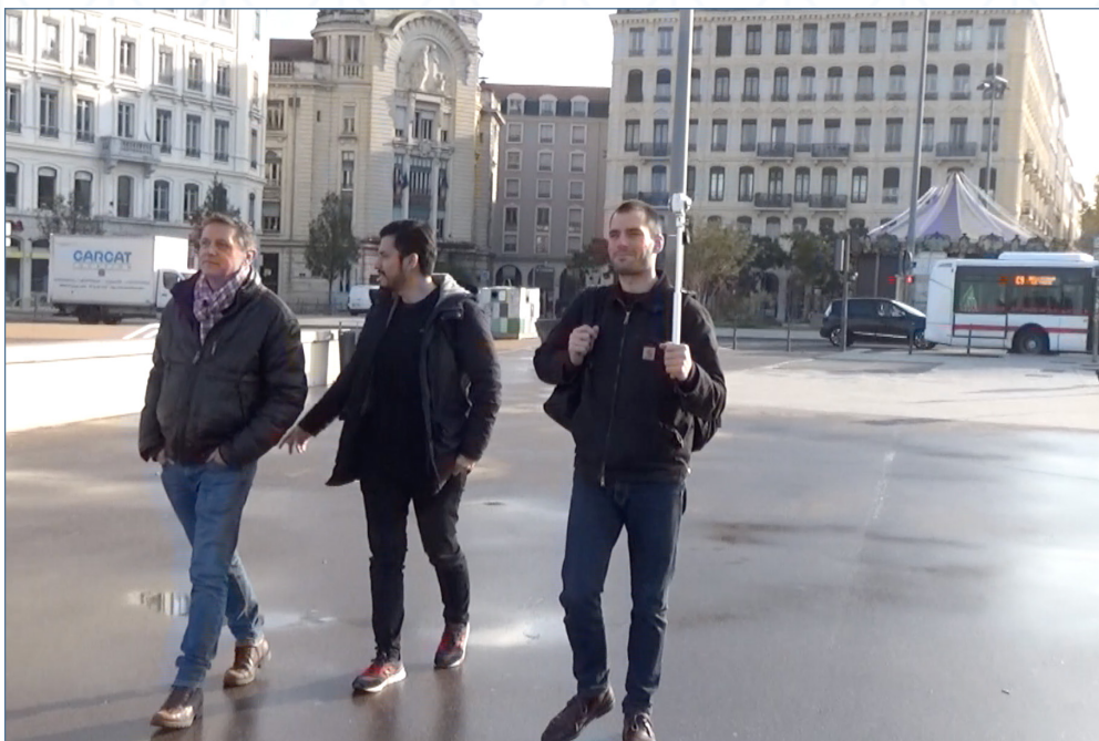
Image 4c – Capture d'écran de l'extrait « Les Berges ». Entretien réalisé le 19 novembre 2019 à Lyon