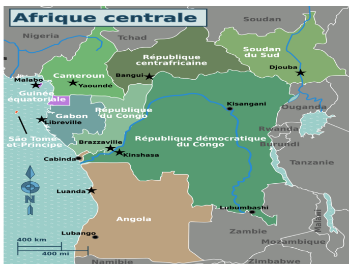
Cartel 1 : l’Afrique centrale montrant la RDC et ses voisins

La période covid-19 a fortement affecté les économies mondiales globalisées et interconnectées poussant ainsi à l’affaiblissement de l’économie des pays pauvres à l’occurrence de l’économie congolaise encore fondée sur l’exploitation des matières premières (les métaux rares et précieuses) et sur le secteur primaire (agriculture de substance et élevage). Ce document est articulé sur quatre points : la situation politique, le social, l’économique, les conflits dans l’Est et le rôle des organisations de la société civile.