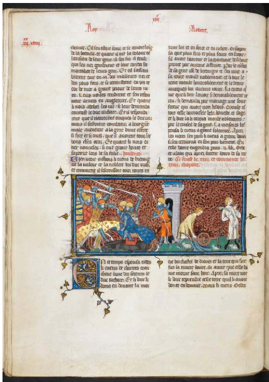
Grandes Chroniques de France, Londres, British Library, Royal 16 G VI, fol. 260