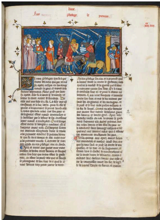
Fig. 2 - Foulques IV le Réchin s'accorde avec Philippe I er pour pouvoir faire la guerre à son frère. Geoffroi le Barbu vaincu il le fait jeter en prison

Grandes chroniques de France, Londres, British Library, Royal 16 G VI, fol. 270