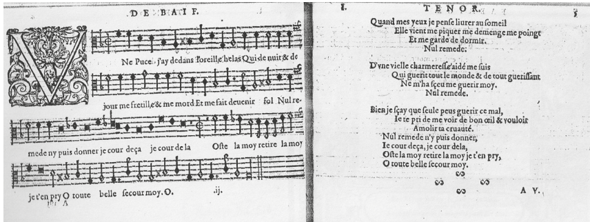
8. Fabrice Caiétain, Une puce