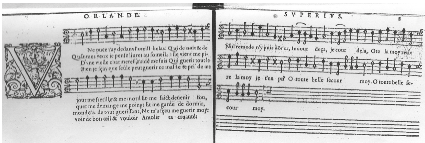
9. Roland de Lassus, Une puce