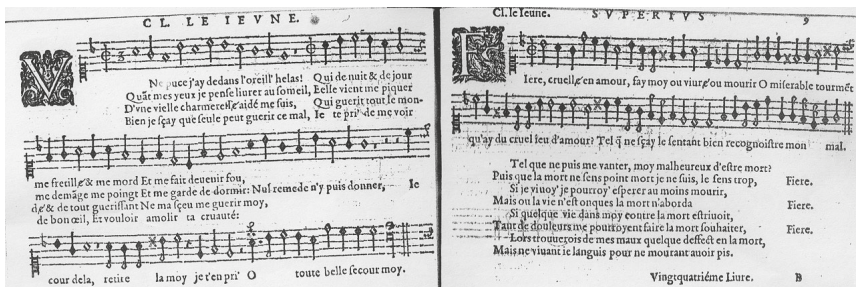
10. Claude Le Jeune, Une puce