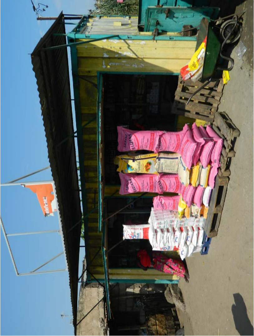
Maputo, avril 2015.