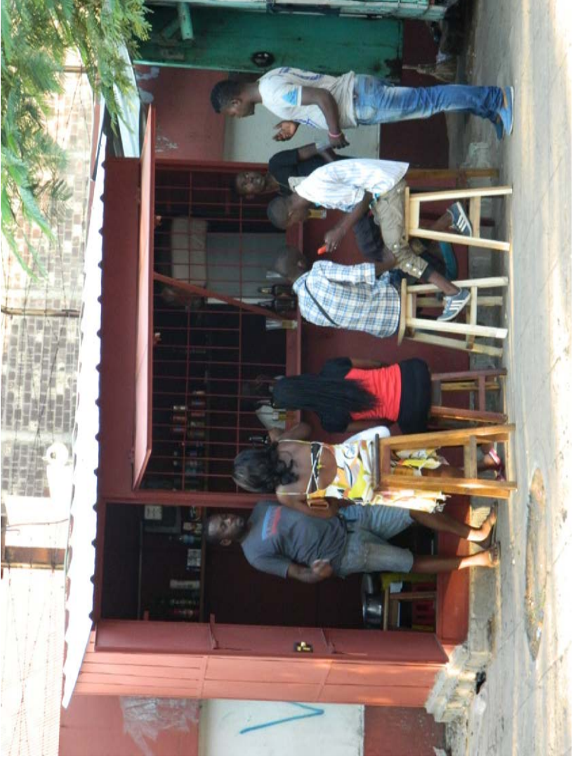
Photographie 2 : Contribution des commerçants étrangers à la vie locale à travers des lieux de sociabilité, ici un barraca (bar de quartier) en périphérie du centre-ville

Crédit : C. Fournet-Guérin, Maputo, avril 2015.