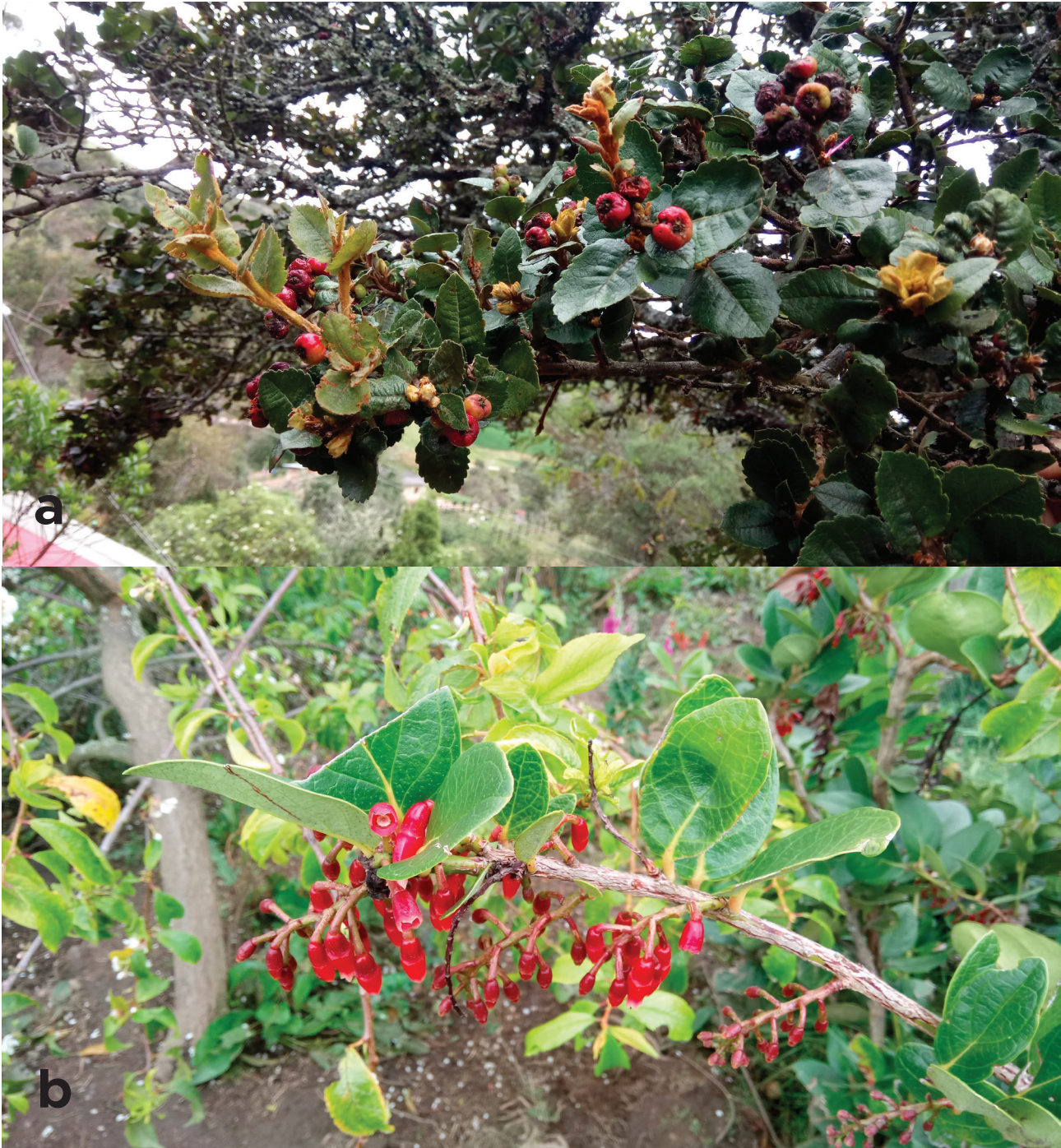
Figura 1. a) Mortiño ( Hesperomeles goudotiana (Decne.) Killip) y b) Uva Camarona ( Macleania rupestris (Kunth) A.C.Sm.) en la ruralidad de Bogotá.

Teniendo en cuenta estas consideraciones, este trabajo indaga sobre los saberes cotidianos relacionados con las prácticas culturales, y los riesgos y oportunidades económicas y comerciales que los sistemas agroalimentarios urbano-rurales promueven con el Mortiño y la Uva Camarona.