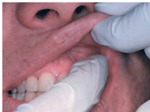
Fig. 2 Palpation intrabuccale.