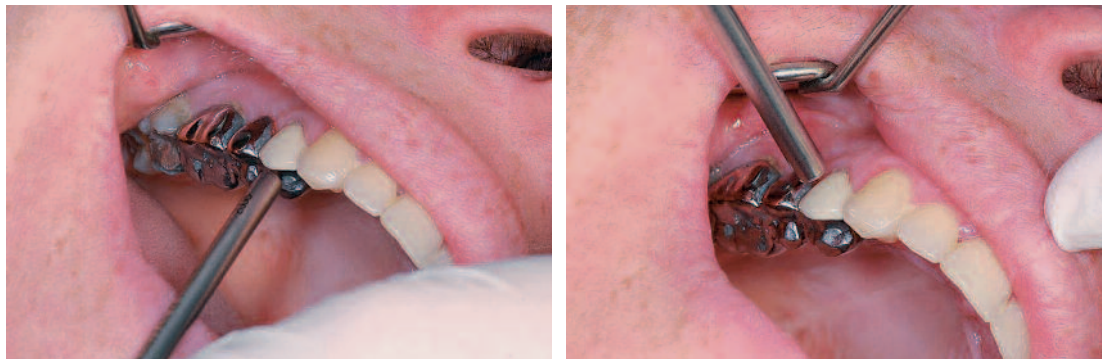
Fig. 3 a et b Tests de percussion axiale et latérale.

– une tuméfaction diffuse (signe du godet) ou collectée et fluctuante.