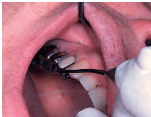
Fig. 4 Sondage parodontal.

perte éventuelle du système d'attache de la dent causale. Il se différencie du sondage parodontal par la pression que l'on imprime à la sonde parodontale. Celle-ci va être promené par petits mouvements verticaux tout autour du collet de la dent suspectée. Si un sondage graduel ou progressif d'aspect en cuvette oriente le diagnostic vers un problème parodontal, un sondage profond et ponctuel signe dans la majorité des cas une fissure ou fracture. Cependant il est important de savoir faire le diagnostic différentiel avec : – une fistule desmodontale d'origine endodontique ; – un défaut embryologique de la dent tel que le sillon palatin cingulaire de l'incisive latérale maxillaire ou une perle ou une coulée d'émail au collet des molaires.