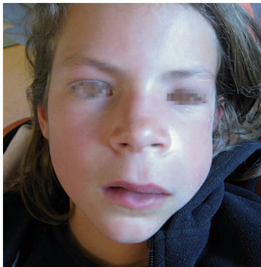
Fig. 1 Vue exobuccale d'une cellulite génienne.

Aires ganglionnaires, contour du visage, ATM, muscles.