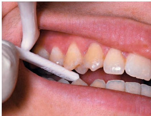
Fig. 6 Test de morsure.

Elle peut être réalisée avec une lampe à polymériser ou mieux encore avec une fibre optique que l'on positionnera perpendiculairement à la dent examinée.