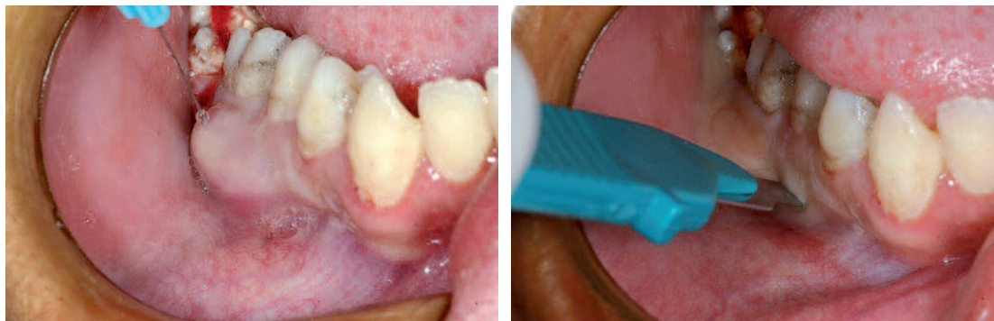
Fig. 9 a à c Vues exobuccale et endobuccale d'un abcès alvéolaire aigu et de son drainage.