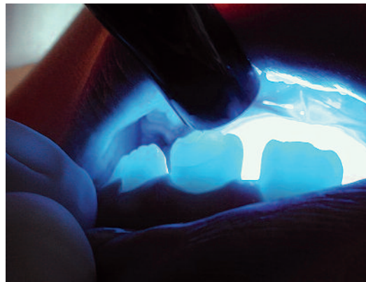
Fig. 7 Mise en évidence d'une fêlure par transillumination.

Ce test est utilisé quand on suspecte deux dents siégeant sur une arcade différente. L'anesthésie