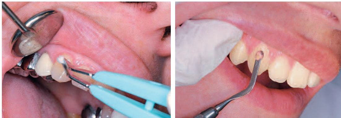
Fig. 5 a et b Réalisation des tests au froid et au chaud.

réponse positive survient généralement rapidement. Une fois cette sensation de chaleur perçue, on retire immédiatement la gutta-percha et on demande au patient de nous signaler si la douleur diminue ou augmente et au bout de combien de temps cette douleur disparaît. Il est prudent de prévoir de l'eau froide pour arrêter la douleur.