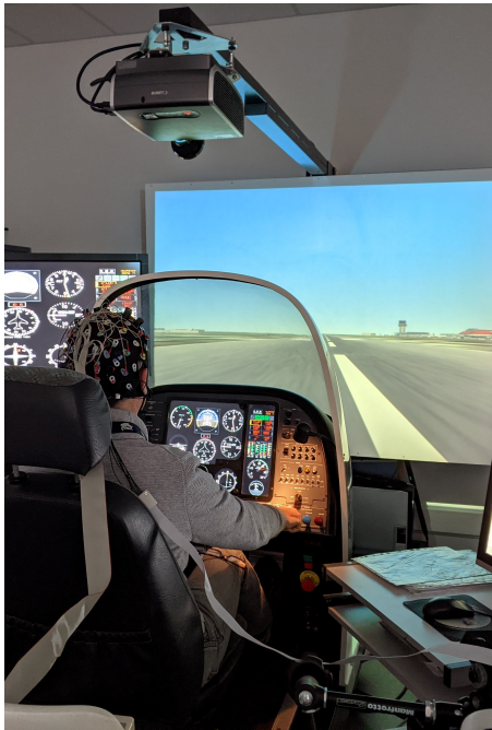
FIGURE 3: Enregistrement des données cérébrales (EEG + fNIRS) du participant au cours de la simulation de vol

2), inspiré par l'application existante SDVFR 2 . Nous testerons cette interface dans un simulateur ou en vol et recueillerons des données quantitatives (taux d'erreur, temps de réalisation des tâches, évaluation de la charge mentale par NASA TLX [13] etc.) et qualitatives (questions ouvertes).