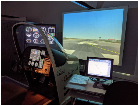
FIGURE 1: Environnement de simulation AL50 de l'ENAC composé d'un cockpit monopilote, d'un visuel rétro-projeté et d'un poste d'expérimentateur

Assistant cognitif; EEG; fNIRS; Aéronautique; Cockpit; Vieillessement cognitif.